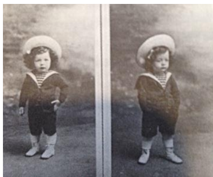
Figure 2. Photo de Willy Ronis de la collection personnelle de Colette Fellous. Image reproduite dans Un amour de frère , p. 21.

Considérons premièrement une photo d'époque d'un petit garçon en costume marin :