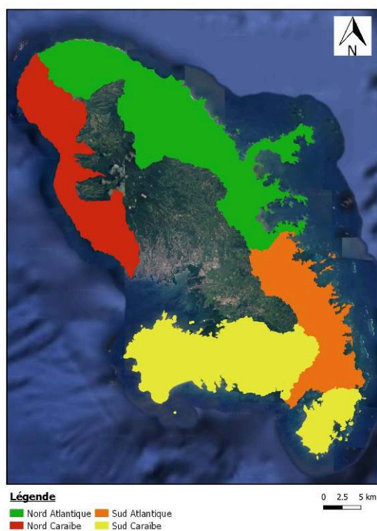
Figure 1. Zones de localisation des pêcheurs Martiniquais.