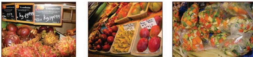
Figure 1. L'alimentation moderne, entre extra-temporalité et extra-spatialité