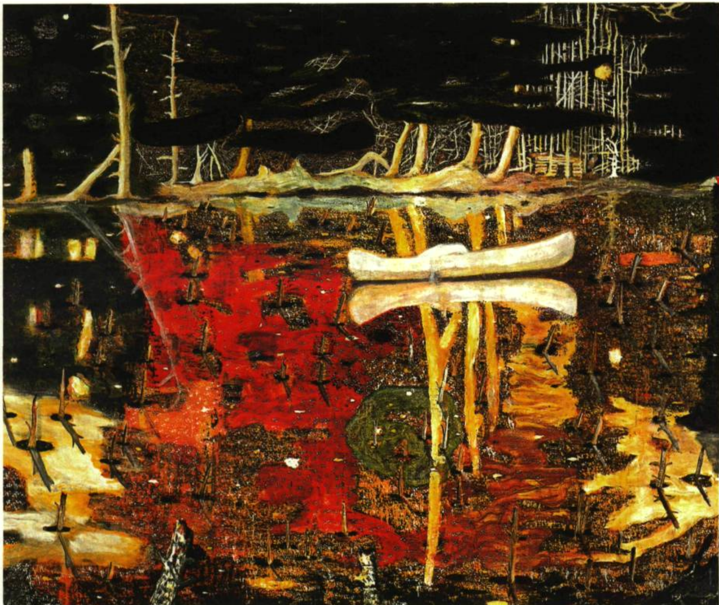
Le canot blanc , 1990 Huile sur toile 197 x 241cm

la bulle financière et immobilière qui a commencé, elle, à se dégonfler au cours du deuxième semestre de 2007, par suite des déboires du marché immobilier aux États-Unis. « Les prix de l'art ont quadruplé depuis 1996 », pouvait-on lire en 2007 dans une lettre londonienne d'un spécialiste du marché de l'art, « Peter Doig et quelques