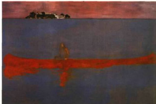
Il y a cent ans , 2001 Huile sur toile 240 x 360 cm

L'impasse qui guette la peinture de Doig, avec sa complexité technique et ses nombreuses références stylistiques, tient à sa surcharge visuelle. Il s'agit, en effet, du danger d'un certain académisme. Récemment, l'artiste a renoncé à la thématique « nordique », pour se consacrer à la lumière et aux atmosphères tropicales. Il s'est installé à Port-of-Spain, dans l'île de Trinidad. Malgré les tentations que lui offraient les paysages luxuriants, il s'est employé à simplifier ses compositions et à en réduire le jeu chromatique et celui des formes. Ainsi, Red Boat (2006) représente quelques personnages peu individualisés, vaguement fantomatiques, assis dans un canot flottant sur l'eau au milieu