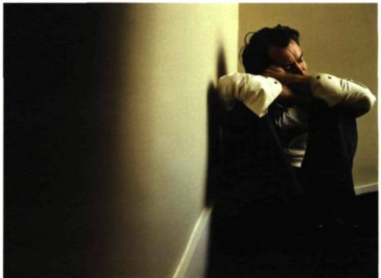
Sam Taylor-Wood Jude Law, 2003 C-Print 86,2 x 111,7 cm (incluant le cadre)

Il s'agit bel et bien d'autopourtraits, mais l'artiste renoue ici avec l'ingéniosité qui caractérisait ses œuvres des dernières années en trouvant encore une manière toute personnelle de renouveler le genre. En effet, personne ne pourrait s'y méprendre, il s'agit bien de Sam Taylor-Wood dans ces pho-