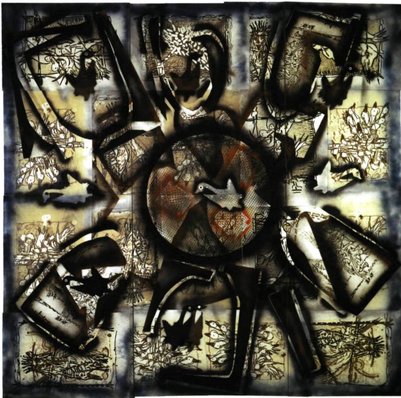
Au pays des ouaouarons, 1982-1983 Technique mixte sur papier marouflé sur toile, sur essais de lithographies de l'album Cap Tourmente , 1983, bouchons de tubes de peinture 317 x 323 cm, Triptyque, 1983.052 Galerie Daniel Lelong, Paris

Le dispositif narratif s'installe dans le déchiffrement des couches superposées de matières et de ponctuations signalétiques au sein de la structure imagée. Ainsi, le terme mutation ne serait-il pas injustement employé? Agent de perversion, il sous-tend l'idée d'une mise en abîme de l'image pour