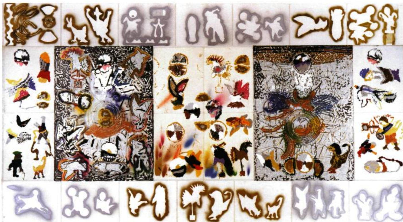
Sans titre, 1989 Technique mixte sur papier marouffé sur bois, avec deux lithographies rehaussées de la série Suites , 1972 262 x 476 cm, polyptyque, 1989.110 Collection particulière

dans un désordre étudié. Parfois, les traces des scissures s'effacent totalement pour laisser place au trompe-l'œil et à la transparence des jeux d'apparences parfois rehaussés d'un coup de pinceau, parfois ranimés par un jet de peinture en aérosol. Ce jeu constant entre l'opacité et la transparence de l'exécution rythme la surface de manière à ne privilégier aucune des parties de l'image. Riopelle marque le « territoire » spatial de motifs apparentés, telle une famille reconstituée, qui lui permet d'exercer son sens de l'équilibre pour mieux le détourner, le pervertir dans l'effacement de toute trace autobiographique.