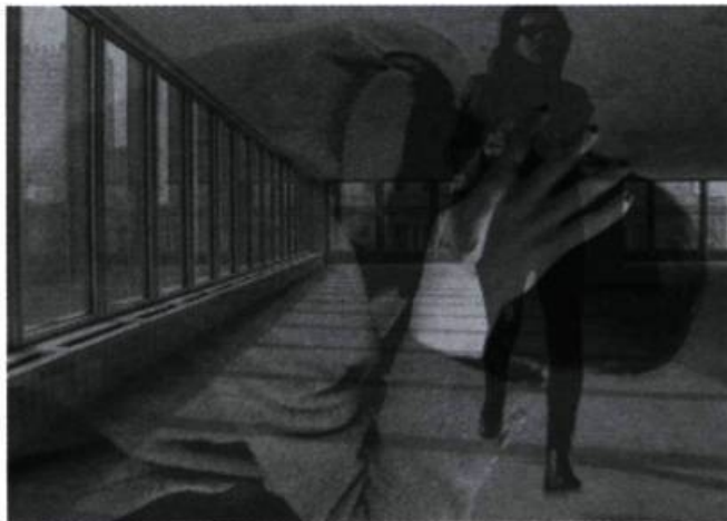
Requiem (détail), 2003 Vidéo

L'œuvre sera présentée au public pour la première fois dans la vitrine du magasin Georges Laoun opticien, par projection sur un écran transparent. Ce dispositif particulier permettra aux clients de l'établissement, ainsi qu'aux passants de contempler simultanément le court métrage.