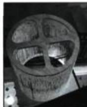
© Alan Storey Ciseau dans une cage, écrivain sa propre histoire, 1999 Installation

L'exposition a pour but de mettre en lumière la place sans cesse grandissante que prend la photographie dans le paysage de l'art contemporain, ainsi que les manières dont les artistes en explorent les limites afin de défier et de dépasser les attentes des spectateurs. Des scènes poétiques, des images documentaires et des œuvres conceptuelles sont donc rassemblées à l'occasion de ce projet rétrospectif qui propose un survol de la photographie canadienne marqué par l'originalité et la réflexion sur la nature de la photographie.