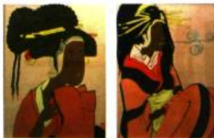
Iona Rozeal Brown, a3blackface#3+#10 , 2000

La rue : lieu de convergence, mode de vie, expression d'une culture alternative qui a inspiré de nombreuses productions artistiques restées en marge de l'histoire de l'art depuis les vingt dernières années. L'exposition Mass Appeal: l'objet d'art et la culture hip hop , une production de la Galerie 101 d'Ottawa, réunit 12 artistes originaires des États-Unis et d'Europe qui ont recours notamment à la sculpture, la photographie, la vidéo, la performance et la peinture afin d'illustrer les particularités de cette sous-culture populaire à laquelle ils adhèrent.