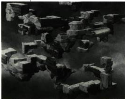
Le mythe des origines Huile sur toile 160 x 200 cm 1998

Expression, Centre d'exposition de Saint-Hyacinthe 495, rue Saint-Simon (Place du Vieux marché), Saint Hyacinthe Du 12 janvier au 10 février 2002