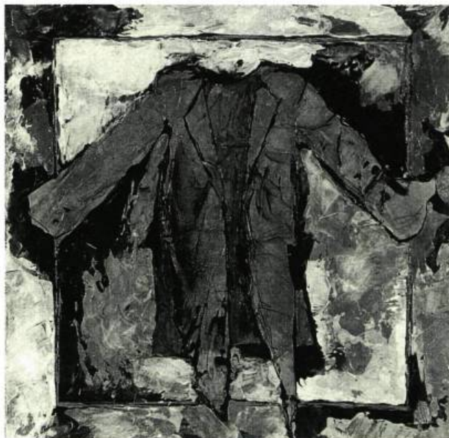
Chlamyde de doulos #4, 1994 Collage et acrylique sur toile 60 x 60 cm Série: Costumes pour le théâtre de l'indifférence

Au cours de son évolution, l'artiste développe toujours une certaine prédilection pour tel ou tel type de matériau, disposition particulière destinée à marquer l'ensemble de son œuvre. D'abord fasciné par la sculpture, Réal Dumais ne fait pas exception: il est devenu un incontournable des œuvres sur papier.