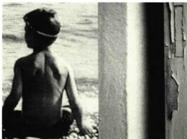
Été 5 52 cm x 39 cm

Au-delà de la simple rime plastique, le rapprochement des deux mondes se conçoit plutôt comme un jeu de tensions où les formes singulières se font advenir les unes les autres. L'angle brutal d'un carreau