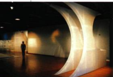
Vue partielle de l'installation

Figure reconnue de l'art public au Québec, Rose-Marie Goulet présentait à la Maison de la culture Côte-des-Neiges un projet particulier d'installation en résidence. L'événement fut élaboré à la manière d'un « work in progress » où la référence concrète et physique de différents documents artistiques (écrits, objets, maquettes...) interrogeait la valeur de l'archive comme l'assise d'une production esthétique en devenir. Les artefacts, utilisés et enchâssés dans de nouveaux dispositifs structurels, ont ainsi conditionné l'émergence de nouvelles entités formelles et conceptuelles, propres à la démarche d'ensemble de l'artiste. L'archive devient ici un prétexte, voire une matière génératrice dont l'un des buts est de reformuler la sculpture dans sa composante installative.