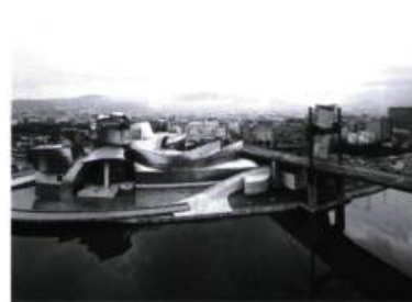
Frank O. Gehry Musée Guggenheim de Bilbao (Espagne), 1992-1997