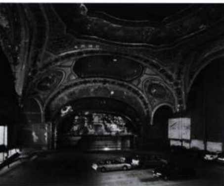
Stan Douglas Michigan Theatre, 1997-1998 Coll. Galerie d'art de Windsor