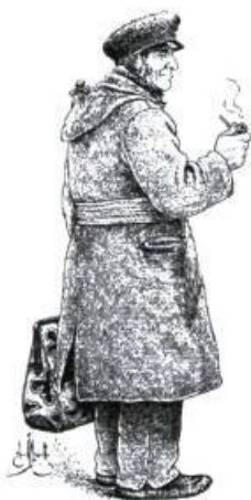
Homme à la pipe

Musée Marc-Aurèle Fortin 118, rue Saint-Pierre, Montréal Rens.: (514) 845-6108 Jusqu'au 27 août 2000