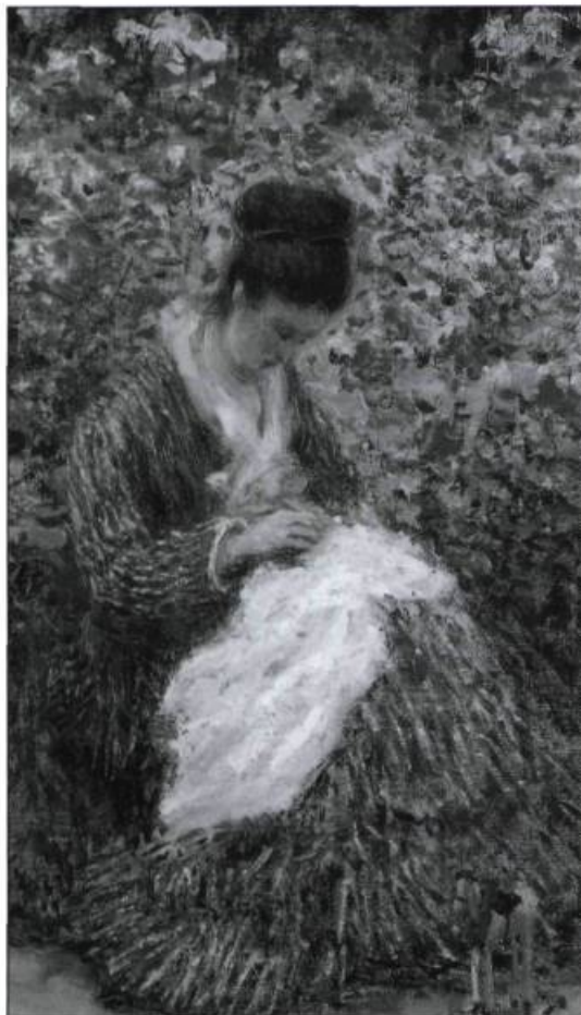
Claude Monet et un enfant dans le jardin de l'artiste à Argenteuil, 1875. Museum of Fine Arts, Boston (détail).