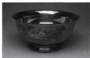
Coupe du championnat des frappeurs de la Ligue Internationale gagnée par Jackie Robinson en 1946 alors qu'il jouait pour les Royals de Montréal. Collection : Alain Choquette

Pour célébrer les 100 ans d'his- toire du baseball au Québec, le Musée McCord présente une expo- sition faisant revivre les moments importants du baseball au Québec depuis le dernier centenaire. Tiré de la collection de l'illusionniste montréalais Alain Choquette, cette exposition fera revivre une expé- rience nostalgique aux plus fervents admirateurs de Rick Moday ou Jackie Robinson. Des jeux permet- tront également aux plus fanatiques de mesurer leur adresse.