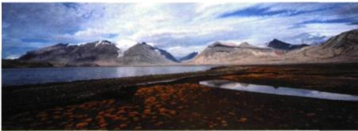
Roberta Bondar La passion de voir