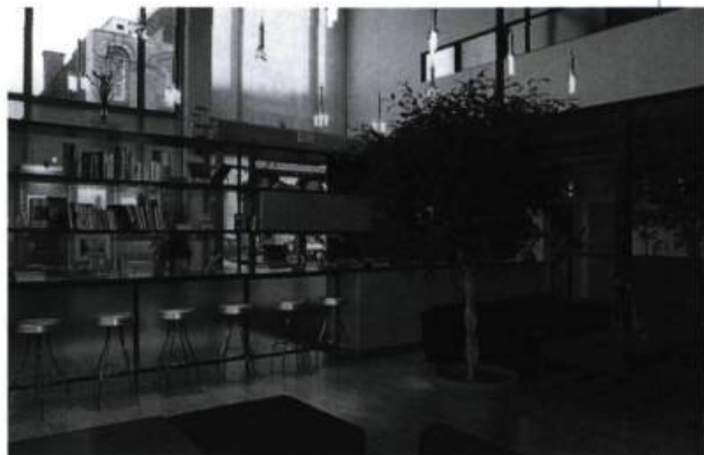
Alfred Dallaire 4231, boulevard Saint-Laurent, Montréal Design : Richer-Noël architectes

Rens. : (514) 872-8076; www.commercedesignmontreal.qc.ca