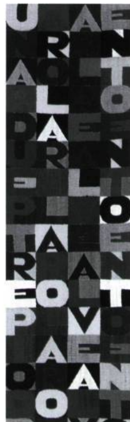
Alighiero Boetti, Una parola al vento, due parole al vento, tre parole al vento, 100 parole al vento, 1989 .

Pour souligner l'arrivée du nouveau millénaire, le Musée d'art de Joliette a monté à partir de ses collections une exposition réunissant 100 œuvres d'art représentant chacune une année du siècle écoulé (de 1900 à 2000). Musée d'art de Joliette 145, rue Wilfrid-Corbeil Du 26 mai au 1 er octobre 2000 Rens.: Myriam Tremblay (450) 756-0311, poste 231