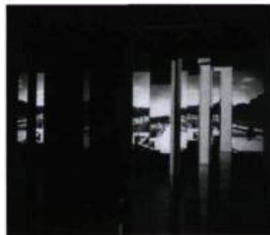
Panorama de Vaux-le-Vicomte, 1998

Née à Vancouver en 1959, l'artiste Vikky Alexander présente une installation au Musée des beaux-arts du Canada. Intitulée Parorama de Vaux-le-Vicomte , l'œuvre est faite d'images sur disque laser projetées sur des colonnes recouvertes de miroir. Ces premières images, inspirées de vues des jardins de Vaux-le-Vicomte, se fragmentent pour interroger les notions de séduction et d'esthétisme. L'exposition se termine le 3 juillet 2000.