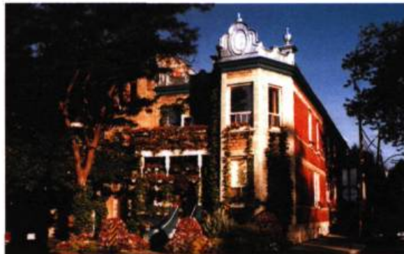
Maison du Parc 1287, rue Rachel Est, Montréal