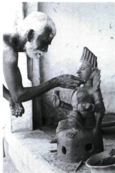
L'Inde, lumière des arts Musée canadien des civilisations