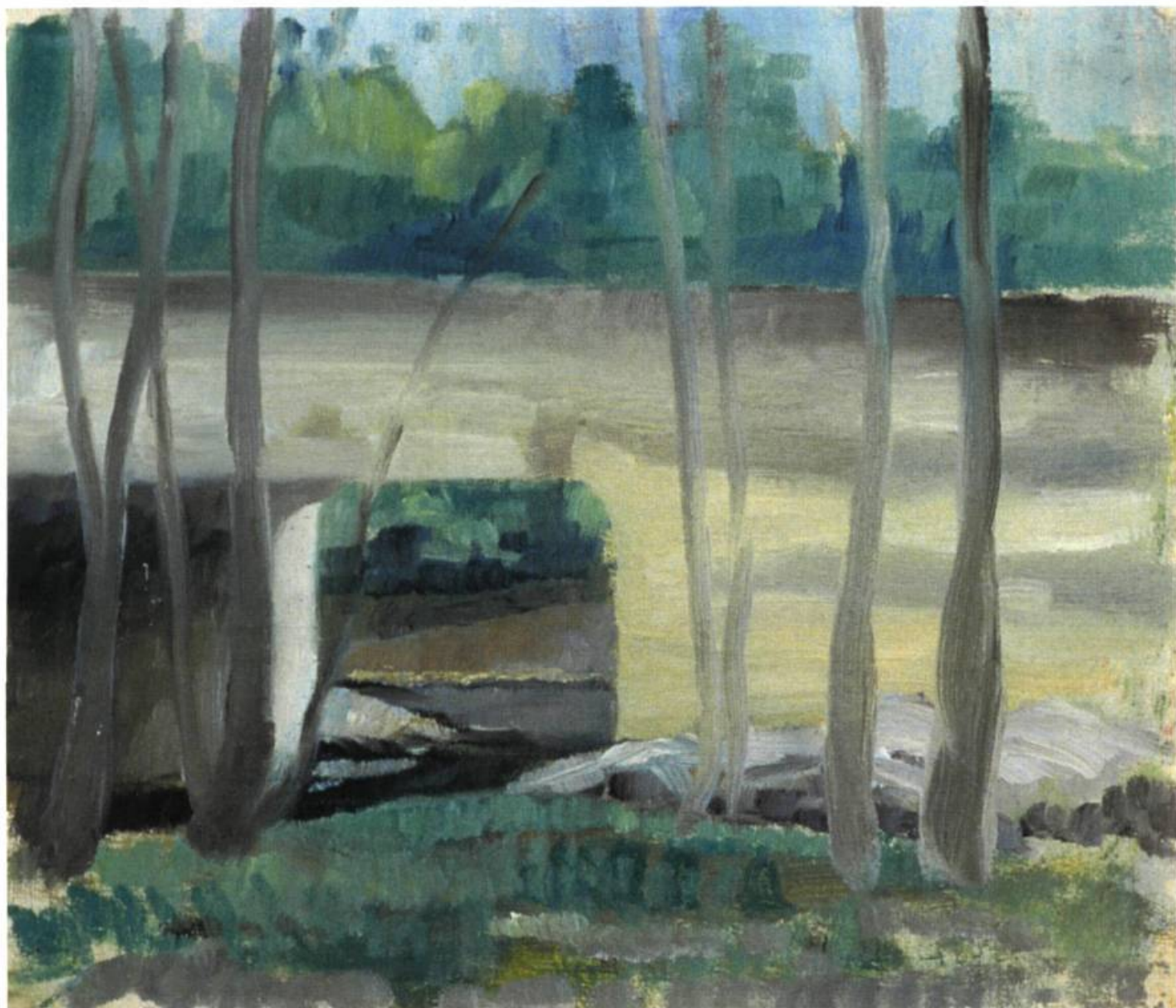
Sans titre, huile sur toile Collection Yves La Roque de Roquebrune