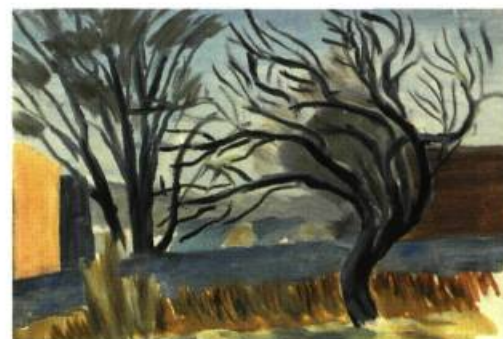
Sans titre ( Arbres au vent ), huile sur toile Collection Yves La Roque de Roquebrune

vision abstraite dans cette Allée d'arbres coupant de larges horizontales, ou d'autres qui ploient, se replient, se cambrent soudain, dans ces légers brouillages de la perspective, cette touche saccadée qui, si l'on s'approche, laisse presque disparaître l'objet!