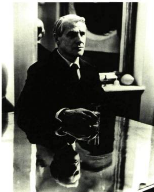
Roloff Beny, Portrait de Willem de Kaening , 1960 photographie noir et blanc, 14 x 16 1/2 pouces Musée des beaux-arts de Sherbrooke