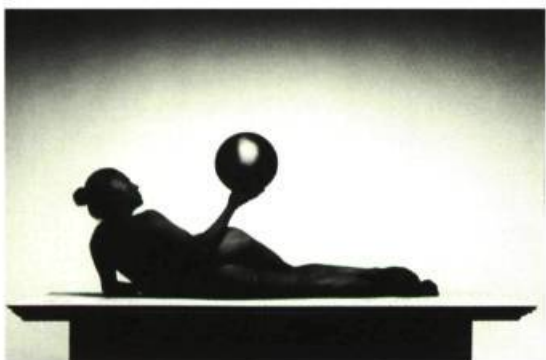
Pierre Charrier, Untitled 630 , 1996 photographie couleur, 20 1/4 x 7 1/4 pouces Musée des beaux-arts de Sherbrooke

C'est alors que le galeriste l'informe ne plus négocier aucune œuvre de l'artiste en question qu'il considère à présent comme mauvais. Désinvolture, maladresse ou naïveté de la part du galeriste? Inutile de porter ici un jugement qui ne nous apprendrait rien. Il