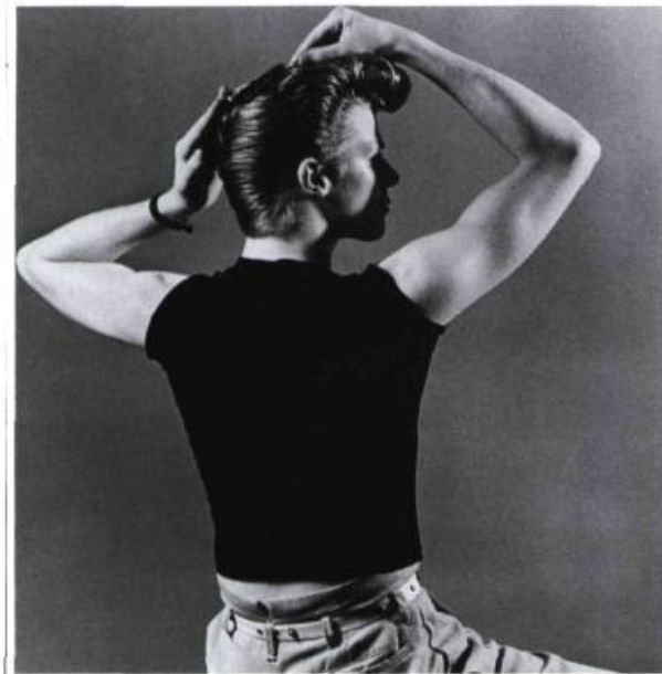
Robert Mapplethorpe, A Stray Cat , 1980 photographie noir et blanc, 7 3/4 x 7 1/2 pouces Musée des beaux-arts de Sherbrooke

imposée aux moyens employés. Faire toujours plus avec toujours moins. Telle l'exige la règle. Jusqu'à ce qu'au-delà de la conjugaison de la règle et du concept on touche enfin à l'essentiel: la collection comme médium. Projection, dissémination et regroupement de soi... Le pas suivant sera de toucher aux autres. D' envisager les autres, au sens de Levinas.