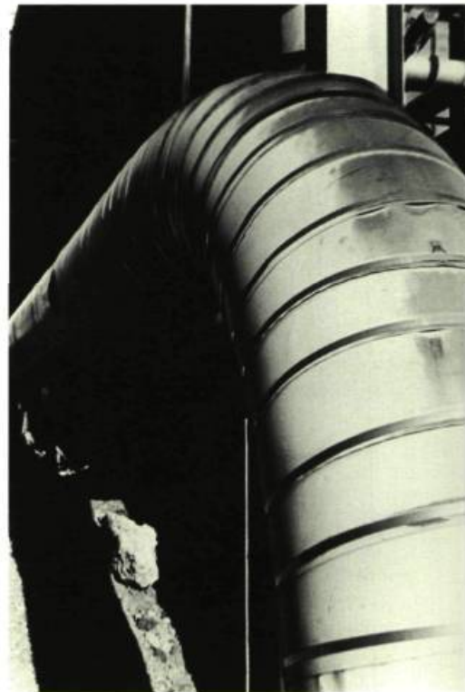
Minor White, Sans titre , tirage de 1978 14 3/4 x 11 3/4 pouces Musée des beaux-arts de Sherbrooke