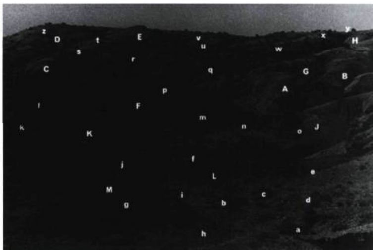
Charles Gagnon, Table des matières , 1993 photographies noir et blanc, 12 1/2 x 19 pouces chacune Musée des beaux-arts de Sherbrooke

contraire, les objets sont trouvés à partir d'une exploration. Celle de la conscience esthétique, qui se cherche elle-même, à l'occasion de se découvrir au coup par coup chez les autres. La collection de LaRoche participe de la seconde manière. Raison pour laquelle avec ses coups de cœur et ses ratures, ses trouvailles et ses reprises, l'histoire de sa cohérence interne affiche en même temps la passion de la reconnaissance des premières œuvres du talent inconnu et le tourment de s'être trompé en accordant sens et valeur à la banalité d'une démarche, et donc en risquant peut-être de cautionner une réputation d'artiste qui ne tiendrait pas ses promesses. Ainsi, les ratures font partie intégrante de son histoire.