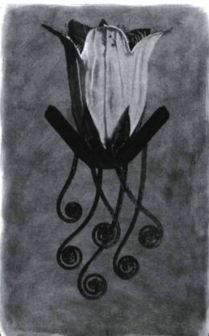
Regénéscence II, 1998 Graphite et lavis sur papier Arches 118 x 77 cm.

À l'équilibre qu'avait imposé la Renaissance, le baroque offre un art à la fois inquiet et passionné, reflet d'un monde agité par des tensions sociale, politique, religieuse et scientifique. L'art du XVII e siècle révèle ainsi le visage d'une Europe en mutation qu'agitent