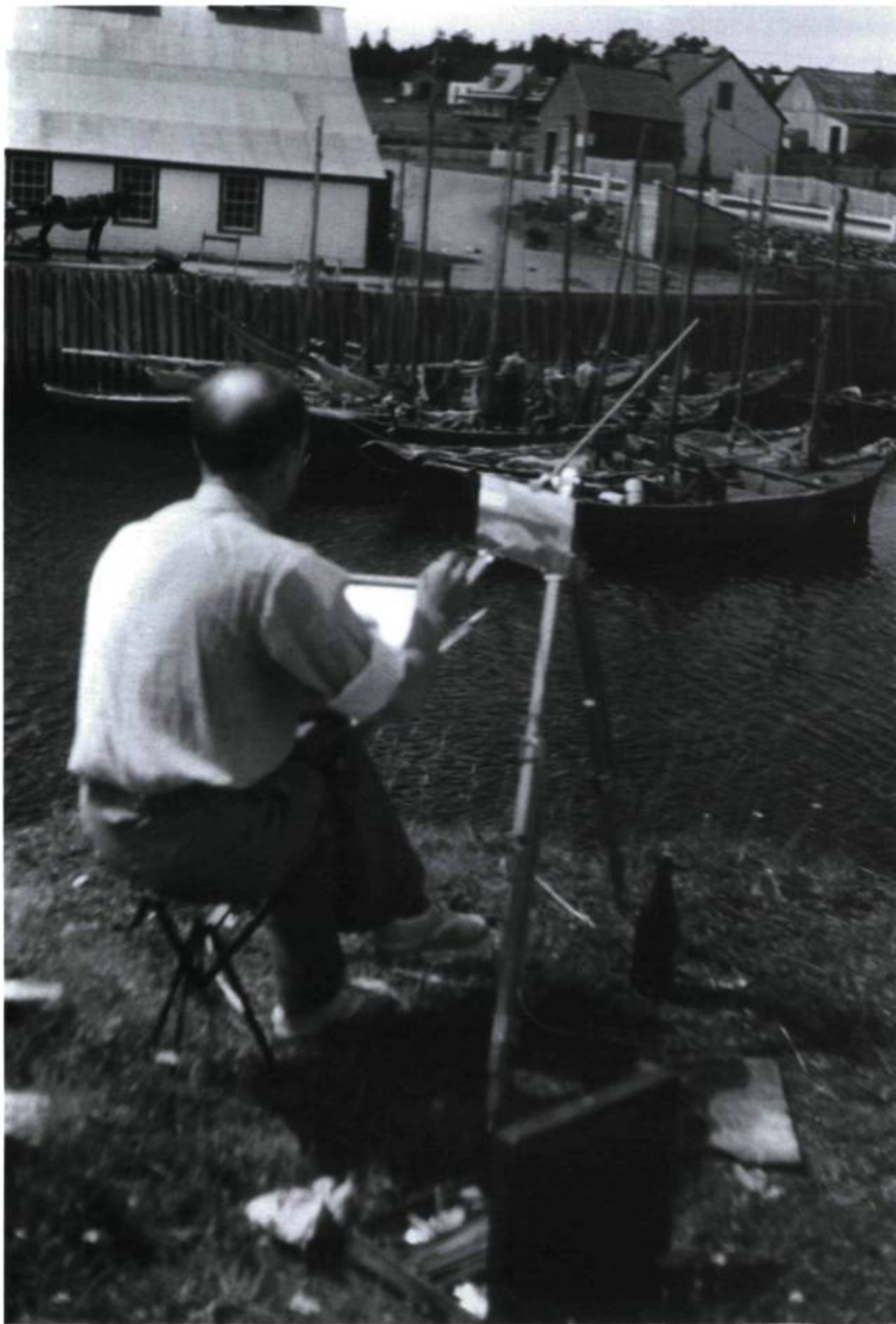
Paul-Émile Borduas à Newport, 1938