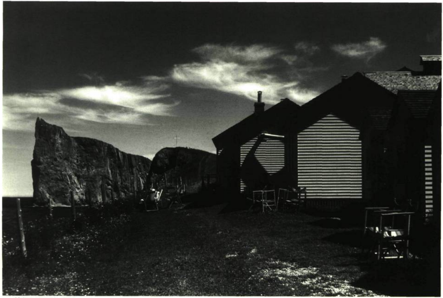
Cabines sur le bord de la mer à Percé, 1938