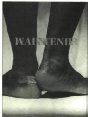
Lucie Duval Maintenir Photographie sur papier fibre 126 x 95 cm