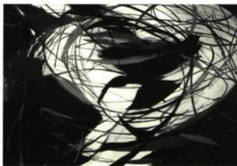
Michel-Thomas Tremblay Les nids dans l'eau , 1997 Huile sur toile 154 x 213,5 cm

Le Prix commémoratif George Wittenborn du meilleur livre 1997 a été décerné au musée d'art de Joliette pour la publication du catalogue d'exposition Raymonde April. Les fleuves invisibles (automne 1997). Ce prix est attribué chaque année par la Art Libraries Society pour les publications qui se distinguent dans le domaine de l'édition d'art.