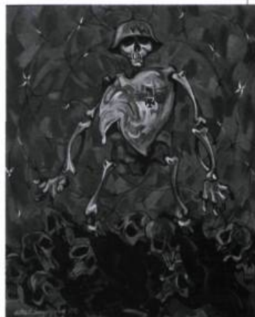
Aba Bayefsky Tout est calme sur le front Ouest , 1988 Huile sur toile, 127,5 x 102 cm

L'exposition Réflexions sur l'holocauste-l'art d'Aba Bayefsky se termine en septembre 1998 au Musée canadien de la guerre. Regroupant plus de cinquante œuvres de cet artiste militaire, la manifestation souligne les horreurs reliées à l'Holocauste. Né à Toronto en 1923, Aba Bayefsky fit ses études artistiques à la Central Technical School de Toronto et s'enrôla en 1942 dans l'aviation royale canadienne.