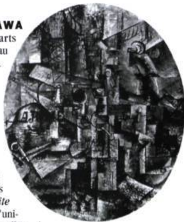
Picasso La table de l'architecte , 1912 Huile sur toile collée sur panneau ovale 72 x 60 cm MOMA

Il sera également possible d'admirer dans la même ville quelque 100 eaux-fortes du maître composant la Suite Vollard à la galerie d'art de l'université Carleton (jusqu'au 31 juillet, renseignements: 613-520-2120).