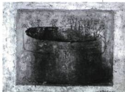
Dina Podolsky Marguerites jaunes dans un pot de cuivre Technique mixte sur toile 76 x 101 cm

Pour consultation: http:// www.Vlady.org/