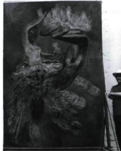
Vlady Caida y descendimiento , 1994 3 x 2 m