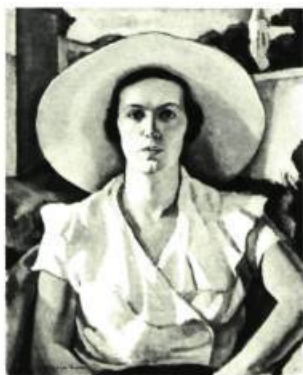
Lillias Torrance Newton Martha , v. 1948 Huile sur toile 76,7 x 61,4 cm

Jusqu'au 31 mai 1998, le Musée d'art de Saint-Laurent accueille l'exposition Au féminin - choix d'œuvres de la collection du Musée du Québec, 1920-1950 . Cette exposition itinérante organisée par le musée du Québec présente une vingtaine d'œuvres de femmes artistes qui furent ou qui sont encore actives dans le milieu de l'art québécois: