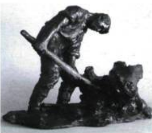
Marc-Aurèle de Foy Suzor-Coté L'essoucheur , c. 1926 Plâtre recouvert d'un enduit Don de Mme Eugénie Côté-Farmer-Saint-Jean et le groupe BKM, 1987

Les travaux d'artistes comme Marc-Aurèle Fortin et Ozias Leduc (peintures, œuvres sur papier, sculptures et orfèvrerie) illustrent le travail de la terre et des champs (info: 819-372-0406 ou sans frais, 1 800 461-0406).