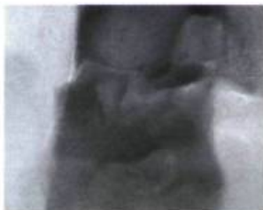
Claude Sarrazin Sans titre Huile sur toile 102 x 76 cm

La couleur comme atmosphère avec des tonalités rêveuses et diluées proche des effets de l'aquarelle, fait oublier la surface qui la porte. C'est en ces termes que Jean Dumont évoquait le ton des œuvres de Claude Sarrazin dont les reproductions ne nous sont pas parvenues à temps pour s'intégrer à l'article Le groupe Penta et la couleur (Vie des Arts No 169 pp. 50-53).