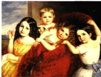
Théophile Hamel, Noémie, Eugénie, Antoinette et Séphora Hamel, nièces de l'artiste (détail) , 1854

DES ŒUVRES MAJEURES SÉLECTIONNÉES PARMILA TRÈS GRANDE COLLECTION DU MUSÉE DU QUÉBEC