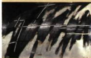
Silence Techniques mixtes sur papier 76 x 112 cm