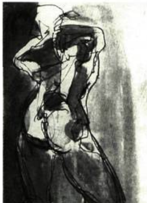
France Malo Nu de dos (détail) , 1997 Encre sur papier 68 x 45 cm

Jusqu'au 23 novembre, le public pourra voir les fruits d'une rencontre entre deux artistes travaillant sur le thème du corps humain. France Malo, artiste de Mont-Saint-Hilaire et Svetla Velikova présenteront leurs œuvres issues de cette collaboration. Informations: (514) 536-3033.