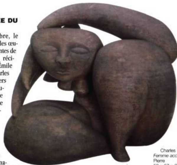
Charles Daudelin Femme accroupie, 1947 Pierre 59 x 67 x 37 cm Coll. : Musée des beaux-arts du Canada

Depuis le 24 septembre, le Musée du Québec présente les œuvres de deux figures dominantes de l'art moderne au Québec, récipiendaires du Prix Paul-Émile Borduas. Le sculpteur Charles Daudelin est l'un des pionniers dans la réalisation d'art public et on lui doit, entre autres, la fontaine de la place du Québec à Paris, à Saint-Germain des Prés (jusqu'au 15 février) (Voir Vie des Arts , No166). Le peintre Fernand Leduc (Voir article dans ce numéro) fut un membre du groupe Automatique et cosignataire du Refus Global en 1948 (jusqu'au 4 janvier).