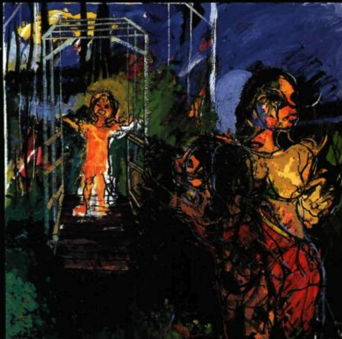
Bridge Series # 1, 1996 huile sur toile 122 x 122 cm