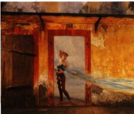
Jacques Léveillé, La vague bleue