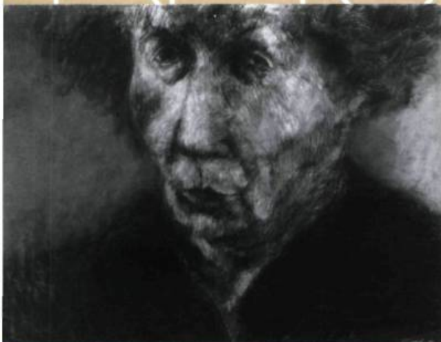
Georges Segal Helen, 1996