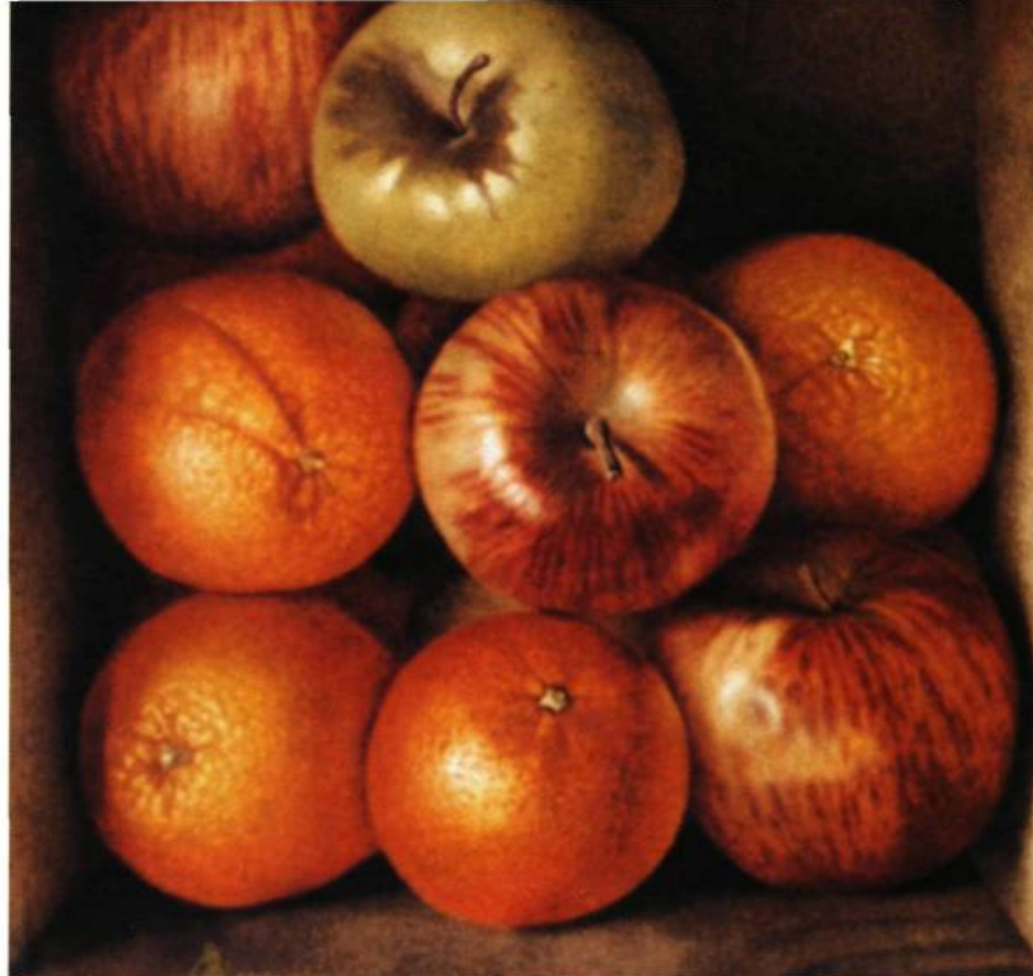
Les pommes vue d'ensemble et détail peinture sur bois

la même chose, des coups de pinceaux comme si quelque recette pouvait nous prémunir contre la magie ! » Est-il important de savoir que ce peintre canadien vivant en Catalogne, qui a grandi au Québec et étudié en Ontario, admirait, jeune, la peinture de Dali et de Colville ? Ce n'est qu'après avoir conquis la liberté technique qui permet « la toile simplement