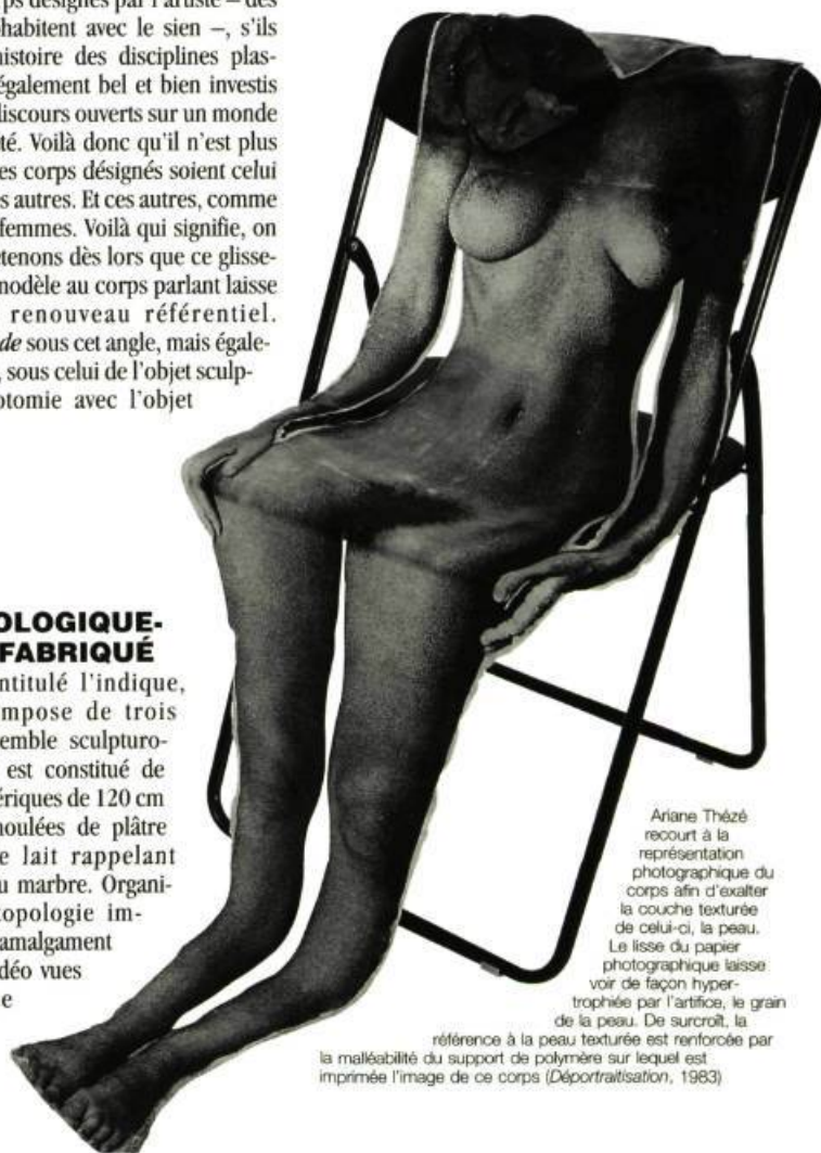
Ariane Thézé recourt à la représentation photographique du corps afin d'exalter la couche texturée de celui-ci, la peau. Le lisse du papier photographique laisse voir de façon hypertrophiée par l'artifice, le grain de la peau. De surcroît, la référence à la peau texturée est renforcée par la malléabilité du support de polymère sur lequel est imprimée l'image de ce corps ( Déportraitisation , 1983).

Certes, précédemment, afin de mettre en évidence la notion de temps et de mouvement de l'image vidéo, Thézé utilise la fixité de l'image photo, de même que la propriété matérielle du plomb texturé reprenant la taille de l'écran photographié, à l'intérieur d'un dispositif stimulant la perception mentale des divers mode de présentation temporelle du réel ( Intéférences mnémoniques , 1992). Il y a là aussi une modification, et c'est dans la poétique de la présentation volumétrique : Thézé rend éloquent un rapport objet technologique-objet fabriqué.