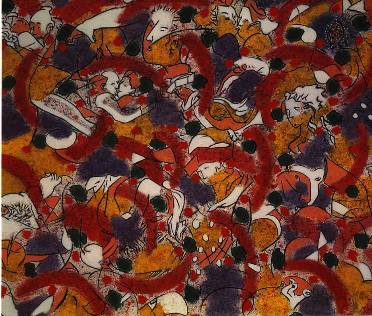
Série !Que Alegria! Osmose ou l'amour fou Huile et 1 acrylique sur toile, 1993 167 x 334 cm

Une importante rétrospective d'une cinquantaine d'œuvres (25 estampes, 20 tableaux et 2 installations) de Pierre-Léon Tétéreault circule au Mexique et en Amérique du Sud depuis le début de l'année 1994. L'occasion nous a paru propice d'interroger l'itinéraire de l'artiste tout au long de vingt-cinq ans de création. Au cours de la présentation de Parcours nomade au Museo de arte moderno de Bogota (Colombie), au Museo de arte contemporaneo Sofia Imber de Caracas (Venezuela) et au Museo Universitario del Chopo (Museo Nacional de la estampa) à Mexico, Tétéreault dira: «Ma pratique puise une partie de sa problématique et de son inspiration au contact assidu des cultures du Tiers-monde, des cultures