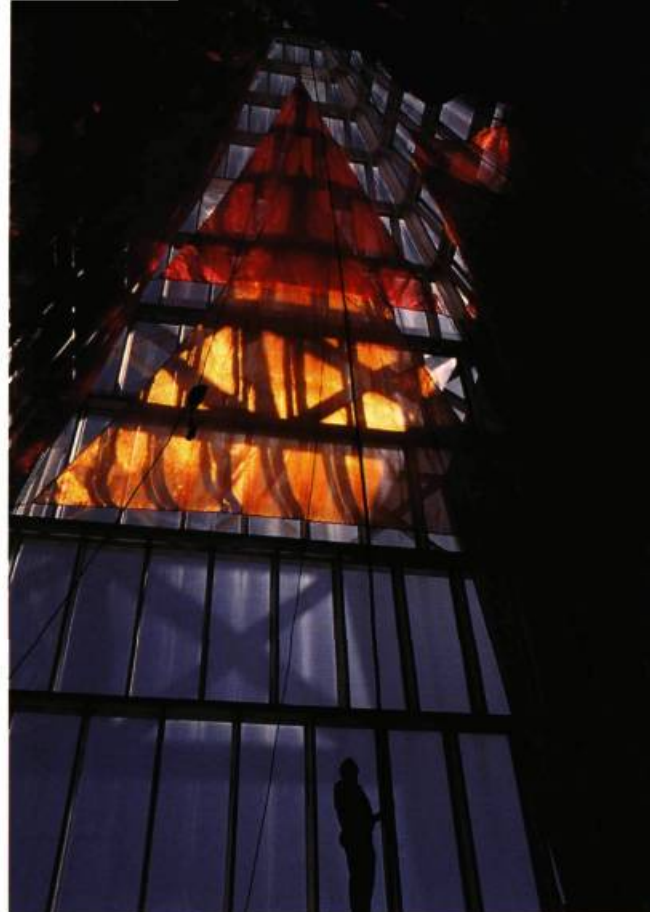
Je veux la lune, 1994 Installation, Hotel de ville d'Ottawa

Oryx Energy a ouvert son concours international (toutes disciplines confondues) en octobre 1991, à quelques artistes soigneusement sélectionnés. En choisissant la maquette du lissier québécois, la compagnie américaine ne désirait pas une tapisserie qui traiterait comme tel du pétrole, mais qui permettrait plutôt de sentir la vocation de l'entreprise. Résultat: «L'or noir» de Micheline Beauchemin est une œuvre plus figurative que ce que cette artiste a l'habitude de