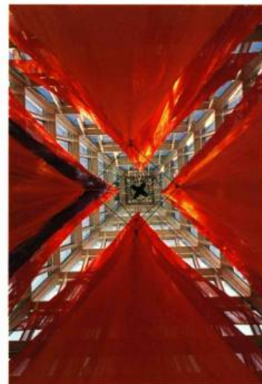
Je veux la lune, 1994 Installation, Hotel de ville d'Ottawa

Peu nombreuses sont les expositions collectives offertes aux jeunes artistes contemporains à l'extérieur des frontières de notre pays, et, à fortiori, hors des sentiers battus qui mènent à