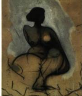
Louis-Pierre Bougie Suite printanière