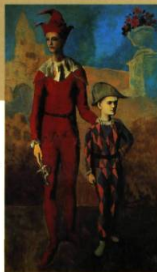
Pablo Picasso Acrobate et un jeune arlequin Collection Fondation Barnes