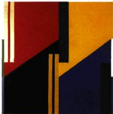
Surface 12, 1987. Huile et acrylique sur toile; 112 x 112 cm. Montréal, Coll. Vasco Ceccon.

Un aparté sur la «beauté» s'impose. Il ne s'agit pas, dans le cas présent, de la beauté d'attraction ou de séduction, de celle qui fait jouir ou souffrir, mais bien d'une beauté abstraite, d'un construit de l'esprit qui se mani-