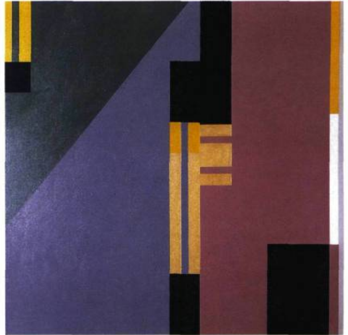
Surface 33 + 19, 1987. Huile et acrylique sur toile; 112 x 112 cm. Montréal, Coll. M. & Mme Coppenrath.

L'art de Palumbo s'inscrit dans la démarche du formalisme constructiviste. Il s'en écarte jusqu'à un certain point en adoptant une attitude ludique tout en respectant la sévérité du processus. S'il est vrai que Palumbo nous propose des œuvres qui provoquent la réflexion, il n'en est pas moins vrai qu'elles nous séduisent tout autant par la justesse des couleurs et par leur composition. Rares sont les artistes qui réussissent, comme le fait Palumbo, à marier la rigueur à la délectation sensorielle. La vision qu'il propose au spectateur est un défi à l'observation: celui-ci voit, ressent, pense. En examinant l'œuvre, il s'examine lui-même. N'est-ce pas là l'essentiel de toute œuvre d'art? ■