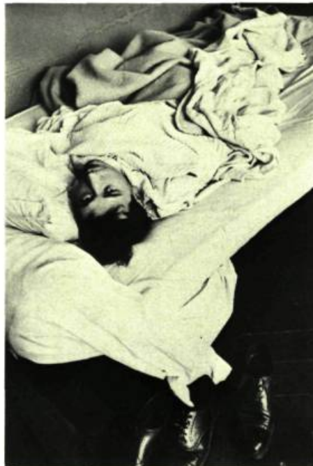
Henri CARTIER-BRESSON (Phot. ©Henri Cartier-Bresson, 1987)

THE MUSEUM OF MODERN ART, 11, 53 e Rue Ouest. Jusqu'au 22 septembre: Gravures contemporaines américaines, de 1960 à 1985; Jusqu'au 29 septembre: William Rau, Photographies sur les chemins de fer; Du 10 septembre au 29 novembre: Henri Cartier-Bresson, Photographies de ses débuts; Du 12 octobre au 5 janvier: Frank Stella, Travaux de 1970 à 1987; Du 16 octobre au 3 janvier: Bill Viola, Travaux de 1977 à 1987; Jusqu'au 8 décembre: Gravures surréalistes de la Collection du Musée; Du 9 octobre au 5 janvier: La nouvelle photographie 3; A partir du 17 décembre: Norman Foster, Architecture.