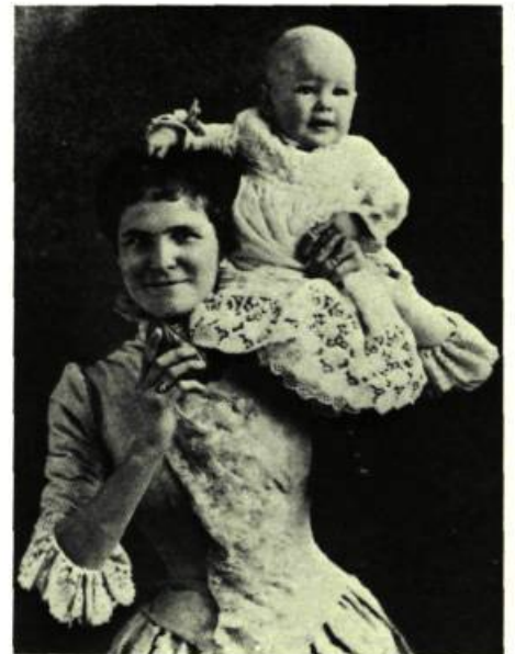
La Mère et l'enfant

MUSÉE DAVID M. STEWART, Vieux Fort. Du 16 septembre au 3 janvier: La Mère et l'enfant (objets et œuvres d'art provenant de collections canadiennes, mettant en lumière l'évolution du rôle de la mère, de sa relation avec son enfant, de leur présence dans la famille et dans la société, au Canada, depuis le 17 e siècle jusqu'à aujourd'hui).