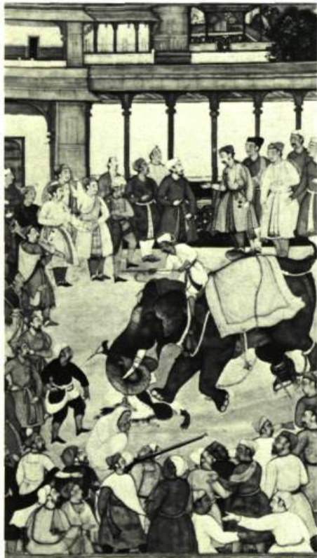
Manuscrit Akbar-nama, Indes, vers 1604.

THE WALTERS ART GALLERY, 600, rue Charles Nord. A partir du 1 er septembre: L'Éléphant dans les manuscrits indiens et iraniens; A partir du 9 septembre: L'Art du contre-facteur; Du 1 er septembre au 15 novembre: Les Ennemis du livre: le feu, l'eau, l'homme, la moisissure et la mutilation des manuscrits; Jusqu'au 11 octobre: Joyaux du Musée et de la Collection de la Famille Zucker; A partir du 17 novembre: La Nativité dans les manuscrits du Moyen Âge et de la Renaissance.