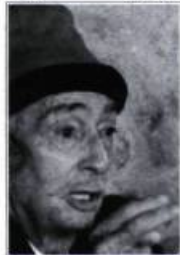
LE DERNIER DALI