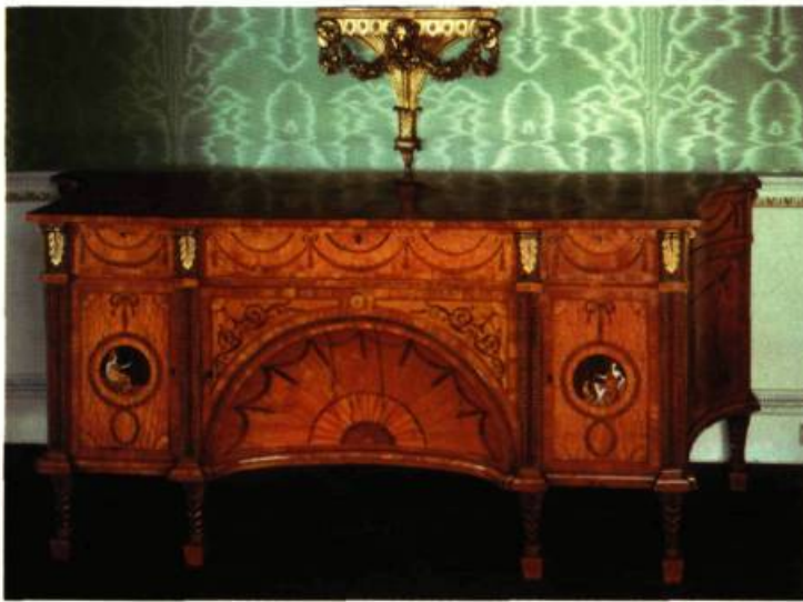
4. Commode Thomas Chippendale. Harewood House, 1773.

The parlours of Kedleston Hall (fig. 1), a neo-Palladian villa begun by James Paine in 1757, were enriched by the decoration of Robert Adam (1728-1792) and the furniture of John Linnell (1729-1796). One of the sumptuous sofas with pattern of sea gods, created by Linnell between 1761 and 1766 for the main salon of Kedleston Hall, is shown at the exhibition. These majestic sofas show the surprising influence of the baroque style as defined by William Kent (1685-1748) on his successors Linnell, Adam and Sir William Chambers (1723-1796).