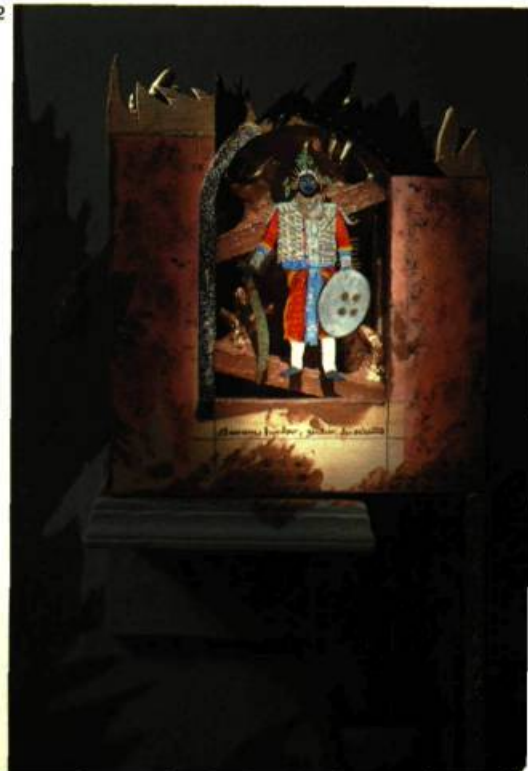
2. Jacques DES ROCHERS Bourreau hindou, gardien des arbustes , 1985. 30 cm 5 x 35,5 x 12,7.