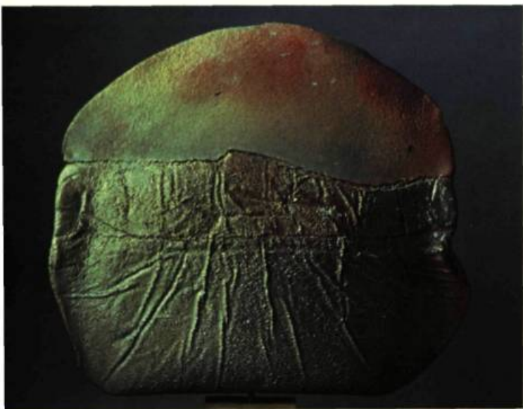
2. Feuille de chair. 45 cm x 38.