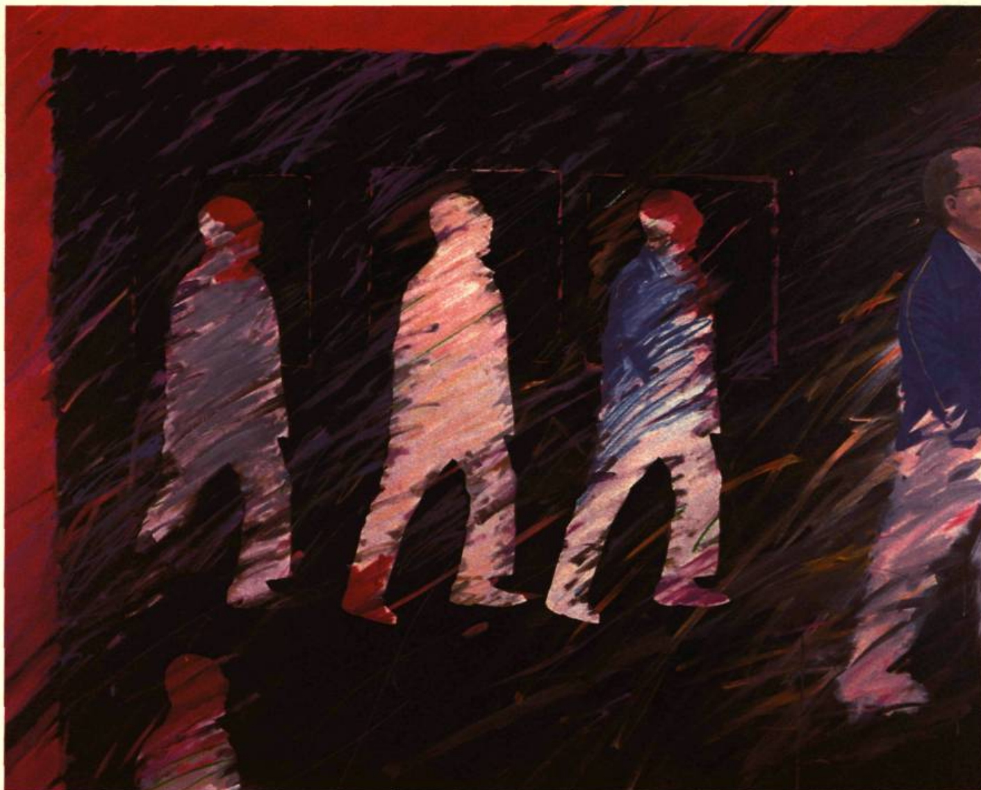
2. En broyant du Blues, 1984. 137cm l x 167,6.

lise, je les change de situation, je les remêle avec d'autres personnages, avec d'autres situations, d'autres fonds, d'autres ambiances. Mais, au départ, il y a toujours une photo, le personnage a été photographié. C'est comme l'arrêter dans une situation, puis après, le réutiliser. C'est une recherche du temps par un mouvement, un déplacement, une répétition du même personnage...»