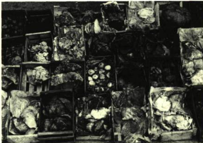
1. Bernadette LAMBRECHT Le Marché oublié , 1982.

Papier-Matière. C'est de cette expression que l'on a qualifié le travail du papier en tant que moyen d'expression artistique. Papier-Matière. C'est sous ce vocable qu'une exposition, organisée par le Centre d'art actuel Langage Plus, d'Alma, a eu lieu au Musée du Saguenay-Lac-Saint-Jean.