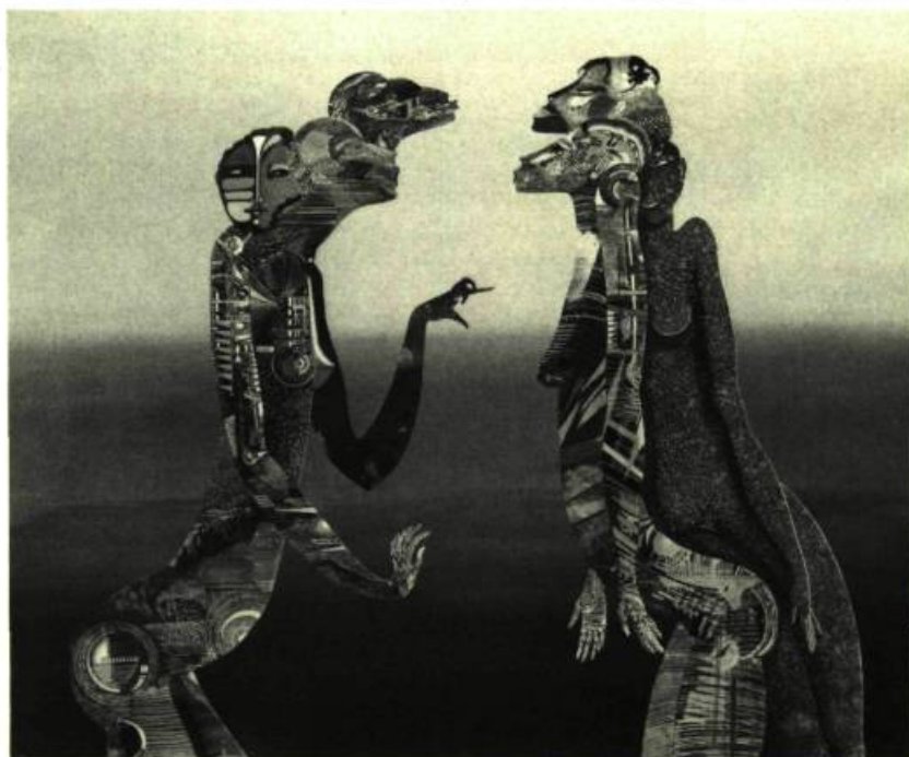
4. Concorde , 1982. Latex sur isorel; 102 cm 2 x 121,9.