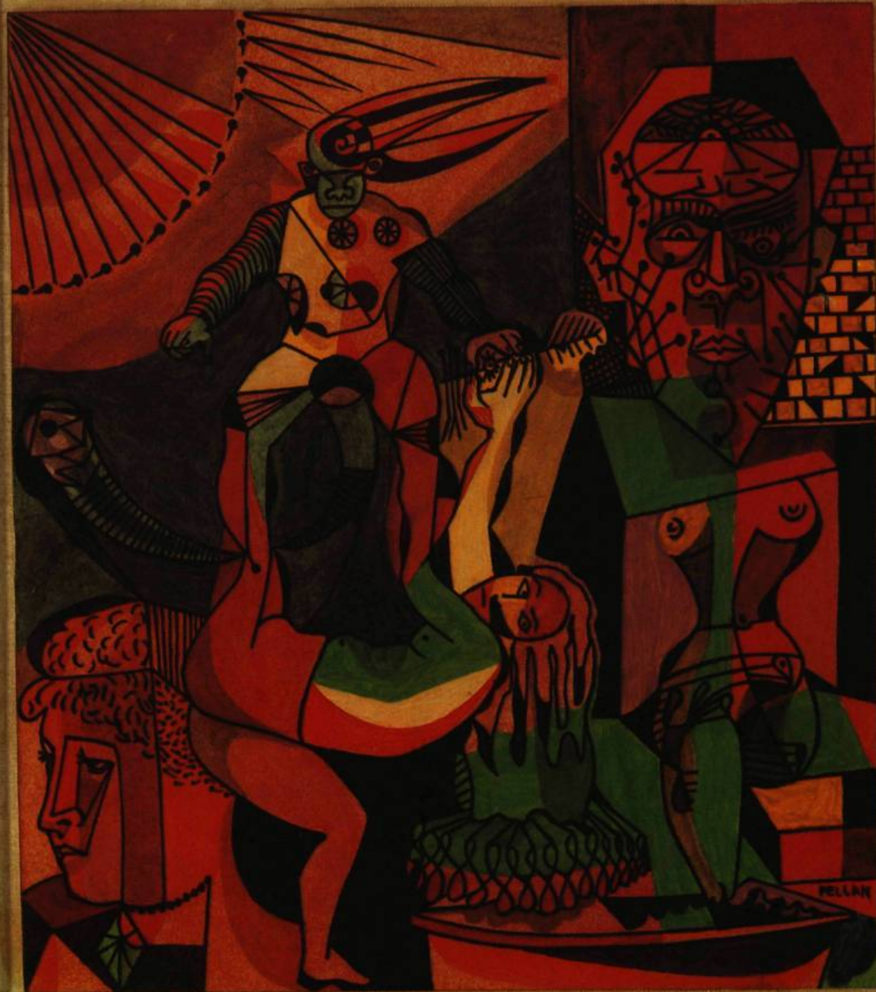
3. Science-fiction . Encre de couleur; 20 cm 3 x 17,5. Ottawa, Galerie Nationale du Canada.