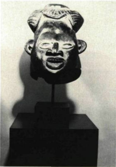
Masque des CAMEROUNS.

GALERIE LIPPEL, 1434, rue Sherbrooke Ouest. Juillet: Les Arts des Camerouns, Figures d'ancêtres et masques; Août: Sculpture inuit en pierre, en ivoire et en os de baleine; Septembre: Art inuit, Coutumes; Art précolombien.