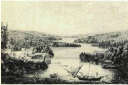
D'après Hervey SMITH.

BEAVERBROOK ART GALLERY. Du 2 au 30 juillet: John Hall, Peintures de 1969 à 1978, et leur préparation; Du 23 août au 20 septembre: L'Oeil magique, Définitions de la photographie; A partir du 15 septembre: La Gravure de paysage au Nouveau-Brunswick, de 1760 à 1880.