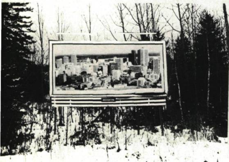
2. J'ai mon truck de New-York , 1979. Sérigraphie; 80 cm x 120.