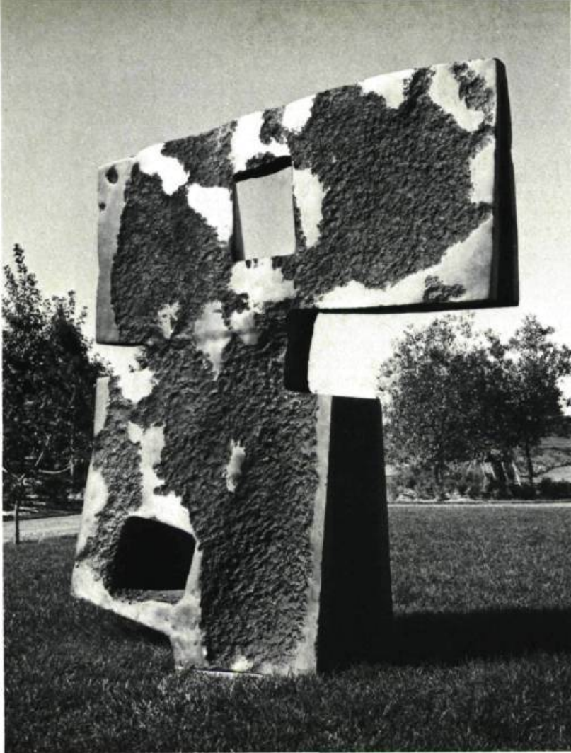
3. Armand VAILLANCOURT Samothrace , 1966. Acier peint; 2 m 52 x 2 x 1,52. Ottawa, Conseil des Arts du Canada.