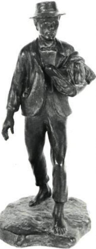
2. Les premières bottines . Bronze.

Les événements de la vie personnelle, parce que reliés aux différentes étapes de la vie, sont représentés avec un sens ou, du moins, une intention chronologique. A même ses souvenirs, Laliberté a puisé ce moment inoubliable des Premières bot-