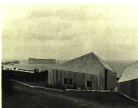
1. Centre d'Histoire Naturelle de Percé. Vue sur le rocher. Architectes: Rodrigue Guité, Denis Lamarre, Jacques Marchand.

On dira peut-être qu'ils sont étranges, ces Canadiens qui construisent des temples pour leurs oiseaux. Pour la Grande Oie blanche de cap Tourmente. A Saint-Joachim, à 30 milles en aval de Québec. Pour le Fou de Bassan, le Cormoran, la Mouette tridactyle de l'île Bonaventure. A Percé, en Gaspésie. Et pour dessiner ces temples, ils choisissent de jeunes architectes bien de leur époque et fort près de la nature.