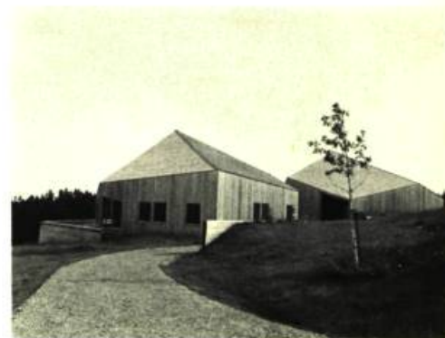
4. Centre d'Histoire Naturelle de Percé. Deux des quatre pavillons en cèdre naturel.

Différents l'un de l'autre mais pourtant fort bien assimilés à leur décor respectif, les deux nouveaux Centres d'Histoire Naturelle du cap Tourmente et de Percé ouvrent le bal du retour à la nature, avec l'invitation à aller voir s'envoler et se déployer les grands oiseaux qui ont pour noms la Grande Oie blanche, le Cormoran, le Fou de Bassan, la Mouette tridactyle, le Goéland à manteau noir . . .