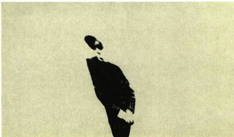
3. Observation , 1973.