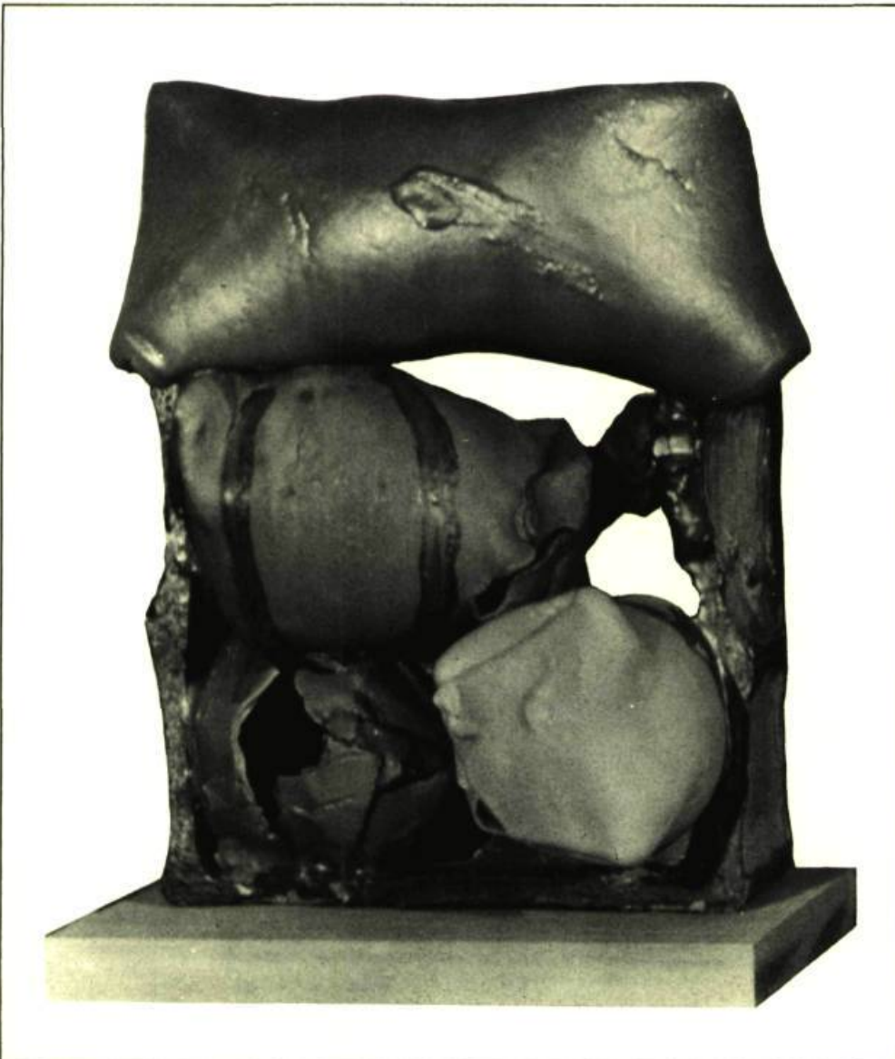
3. Michel SAVOIE Sans titre , 1974. Sculpture céramique; 43 cm x 33 x 25.

persistent dans une certaine ségrégation de la part de ceux qui se disent avant tout des créateurs envers les professeurs qui, tout en assumant leur rôle d'enseignant, réussissent à réaliser une production continue. Or, ces artistes de la génération des 30-40 ans sont tous des praticiens qui, après leur apprentissage à l'École des Beaux-Arts de Montréal, ont enseigné dans des écoles primaires ou secondaires. Ils enseignent maintenant, à l'Université du Québec à Montréal — à plein temps ou comme chargé de cours, et, malgré leur tâche de professeur, ils produisent des œuvres personnelles de qualité.