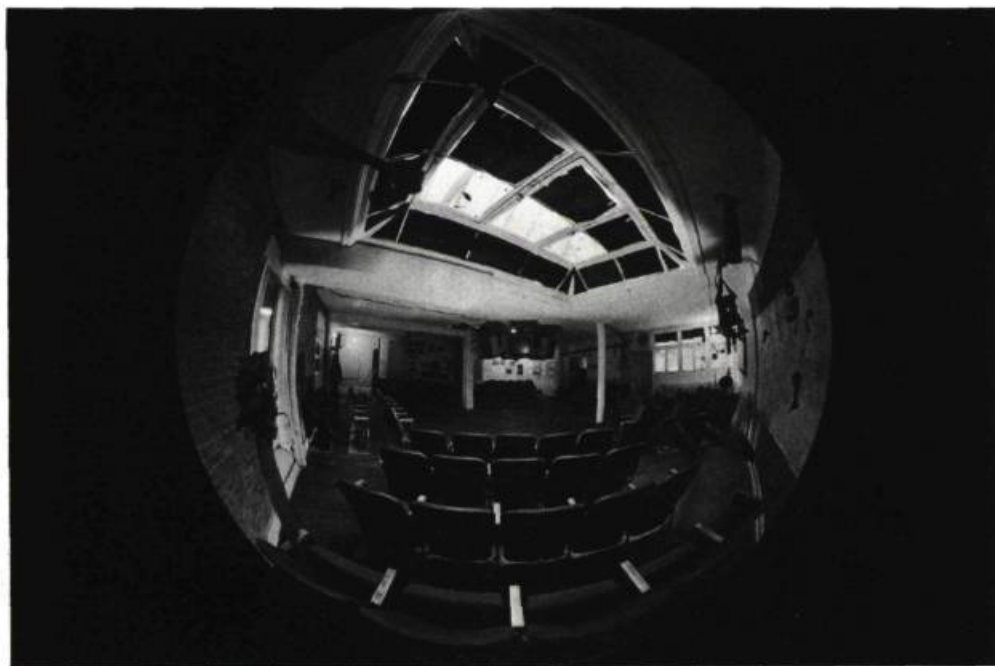
5. Le Vidéothéâtre de Vidéographe, d'une capacité de 115 sièges, est muni de six écrans de 24 pouces suspendus au centre de la salle. Cette topographie est propice aux échanges et discussions qui suivent chaque visionnement.

Rappelons que toute personne, sans expérience préalable, peut présenter un projet de vidéogramme sur quelque sujet que ce soit.