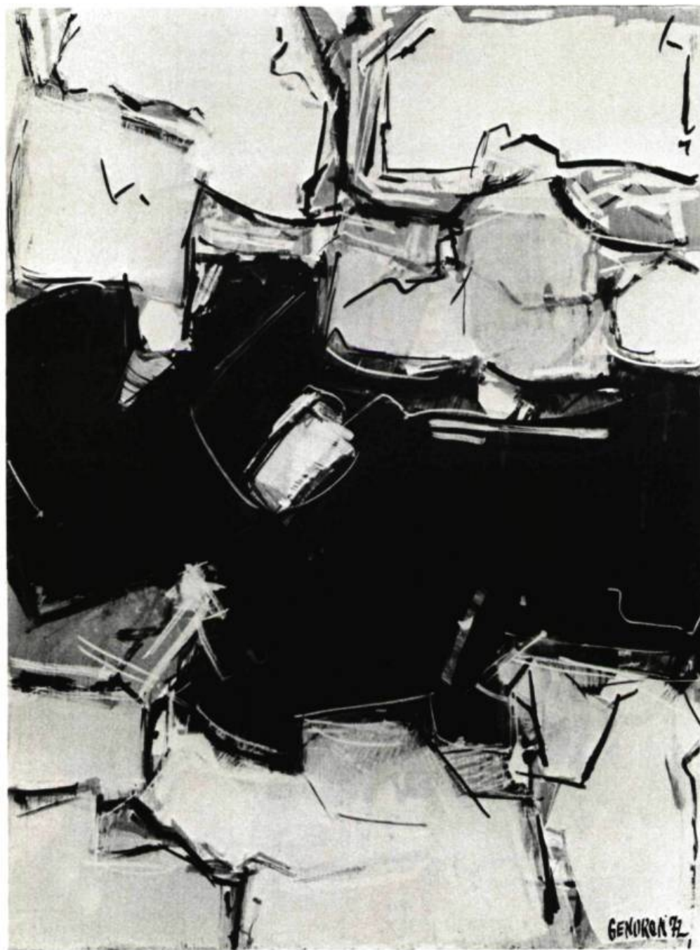
2. Composition , 1973. Acrylique sur toile; 20 po. x 16 (50.8 x 40.6 cm.).