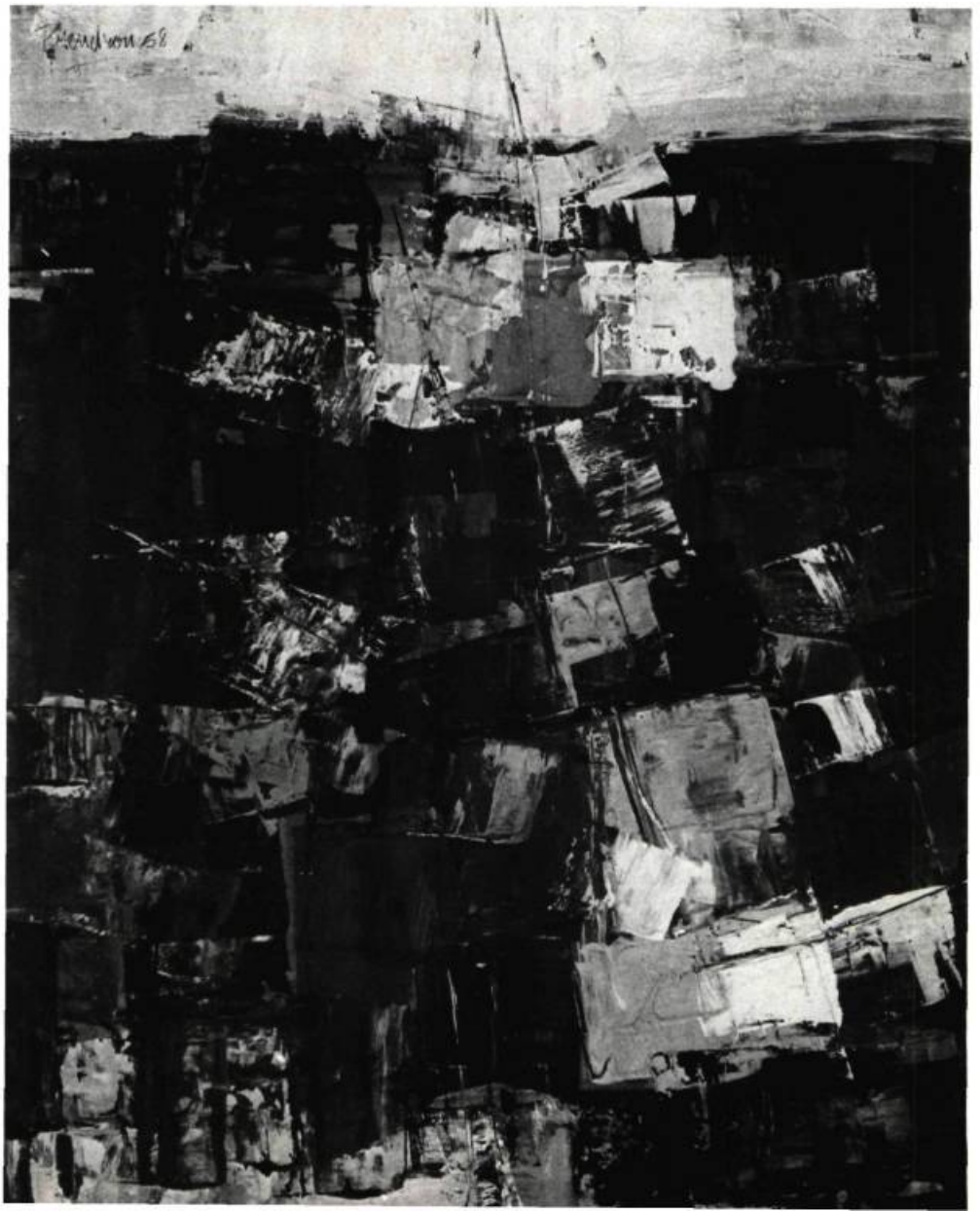
1. Composition , 1958. Gouache; 24 po. x 18 (60.9 x 45.7 cm.)