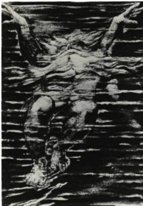
1. William BLAKE Gravure tirée du Livre d'Urizen , 1794. L'espace acoustique est une sphère dont le centre est partout et la circonférence, nulle part. Blake est l'exception à la règle linéaire du XVIII e siècle, retour impromptu à l'art magique de l'âge des Cavernes.

Lire McLuhan, c'est chercher la phrase ou le mot qui, à un endroit quelconque du texte, envahit soudain la conscience du lecteur comme un souvenir auquel il ne s'attendait pas. L'image que l'on se fait de l'horizon intérieur change qualitativement. Une transparence originelle révèle tout le texte. La mémoire individuelle du lecteur cède à une mémoire plus vaste qui soumet simultanément de multiples présences à une intelligence maintenant soucieuse de ne pas imposer ses préjugés. Peut-être, est-ce là tout simplement passer de la fragmentation à la concentration.