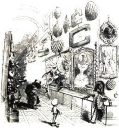
Un art cinétique et agressif.