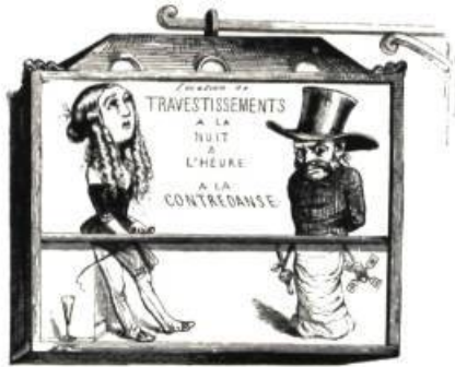
Un philosophe du masque.