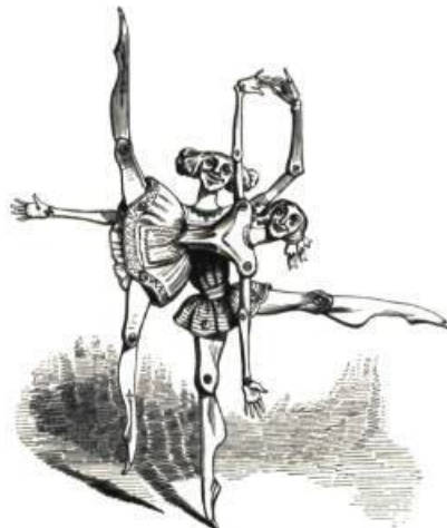
Deux danseurs à ressorts articulés.