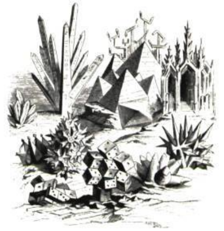
Cristallisations de l'architecture.