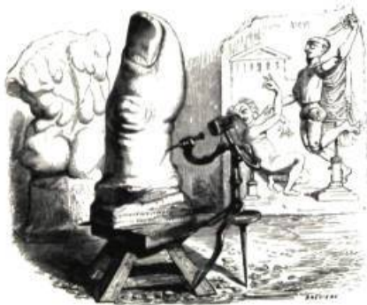
Une étonnante anticipation du Pouce de César .