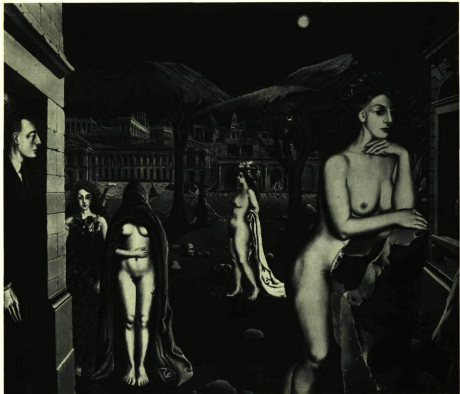
Ci-dessus : Paul Delvaux (Belgique). La cité endormie. 1938.