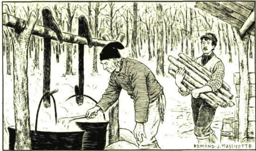
Page ci-contre: Cabane à sucre au printemps. Région de Saint-Benoît, comté Deux-Montagnes.