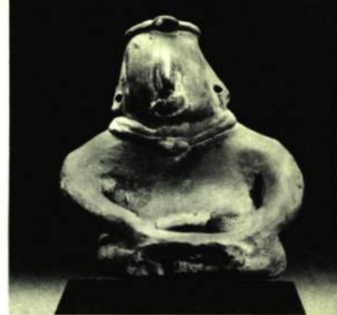
Figure 6 Jalisco H. 5" (12,75 cm.)

Le style Colima est plus monumental, plus stylisé et plus sévère que celui de Nayarit, son voisin, auquel on l'oppose généralement. La coiffure et le collier sont de coton: signe d'appartenance à la déesse.