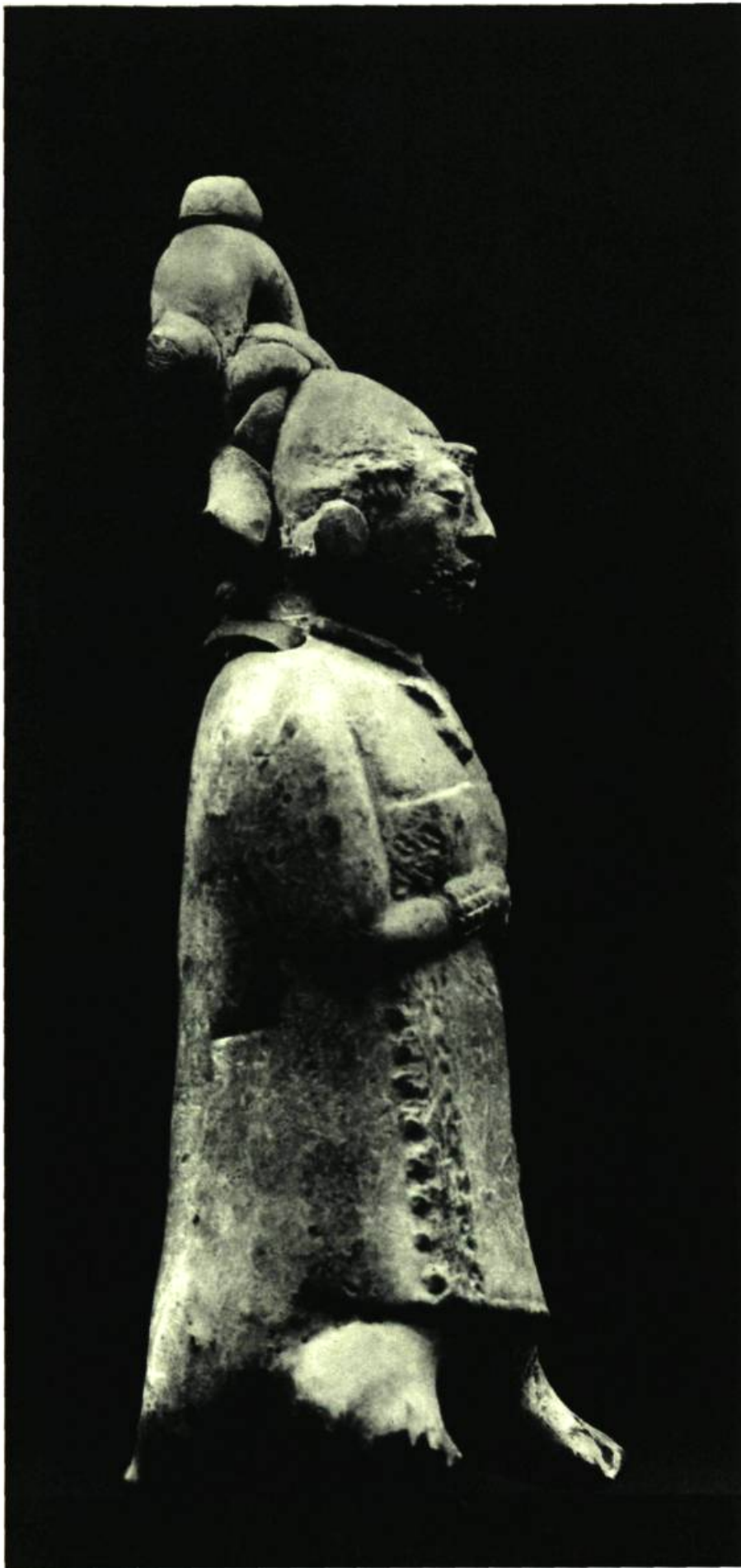
Figure 1. Tlatilco. ♦ H. 2 \frac{1}{4} " (5,75 cm.)

Ces pièces sont parmi les plus anciennes trouvées en Amérique. Thème de la fécondité. Aucun tatouage, ni ornements encore. Traces d'un rouge très vif : toutes les couleurs ont un sens symbolique et sacré. Ici, le rouge signifie le vent d'est et le sang de la femme mariée. Noter le petit chapeau.