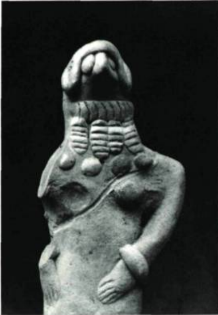
Figure 4 NIN-GAL (la grande dame) Ur. (3,800 avant J.-C.) H. 4½" (11,5 cm.)