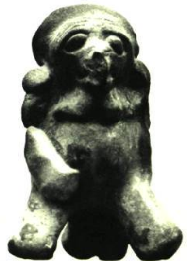
◆ Figure 10. ◆ Sifflet et grelot. Yucatan. H. 3 \frac{1}{4} " (8,28 cm.)