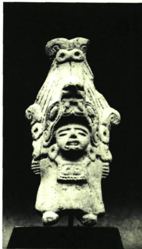
Figure 15. La déesse Ixquic. H. 5/4" (13,30 cm.)

Ces têtes sont connues depuis longtemps. Elles sont légèrement différentes chez les différentes cultures. Celle-ci est Olmèque : tête d'enfant qui se rattache peut-être aux Jumeaux de la mythologie. Mais, analogues aux ex-votos des athlètes grecs, ces sculptures représentent, croit-on aujourd'hui, les jeunes gens offerts en sacrifice : figure d'extase où le rectangle sacré encadre un sourire étrange partagé entre la joie de l'immolation et l'horreur de mourir.