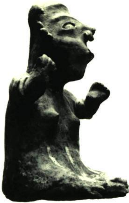
Figure 3. Nayarit. H. 8 1/2" (21,4 cm.)

De Nayarit sur la côte Pacifique. Plus dramatique que l'art de Colima, son voisin. Tête déformée intentionnellement. Bouche dans le sens d'une signification mystique de la prière. Mélange des formes de la femme adulte et de l'enfant (voir le texte). Ornaments des oreilles et du nez.