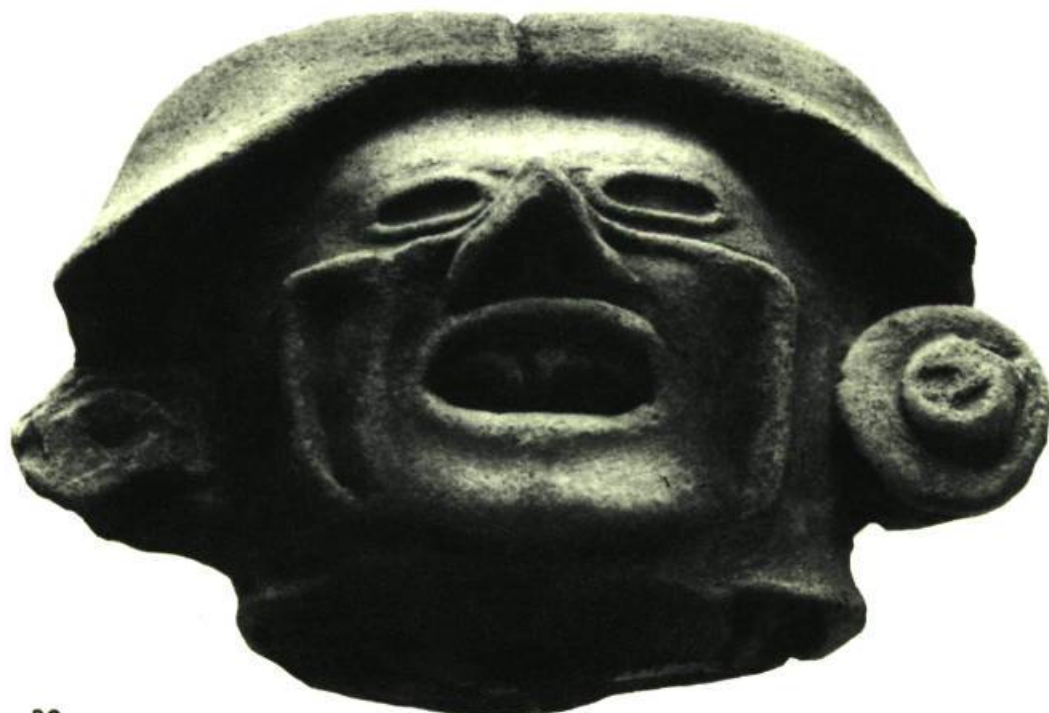
Figure 14 Olmèque. H. 3 1/2" (8,90 cm.)