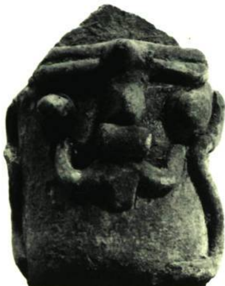
Figure 7. Coupe rituelle. Origine inconnue. H. 3 1/4" (8,30 cm)

Appareil creux et réceptif, l'oreille, chez la plupart des primitifs, est vue comme un organe féminin spirituel qui reçoit la parole manifestée ou secrète qui féconde l'esprit. De là diverses interprétations: assez charnelle (fig. 1) ou bien géométrisée-moralisée (fig. 6 et 8) ou les deux (fig. 13), enfin ornée (fig. 2, 3, 14, 16). Signification féminine des lourds disques de jades. Ces parures ne soulignent que l'exaltation de la parole reçue et la pénitence de celui qui la reçoit (voir le texte).