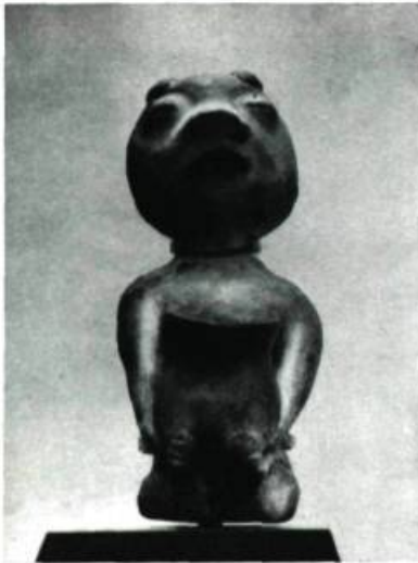
Figure 11. Statuette funéraire Pueblo(?). H. 5 \frac{3}{4} " (14,65 cm.)