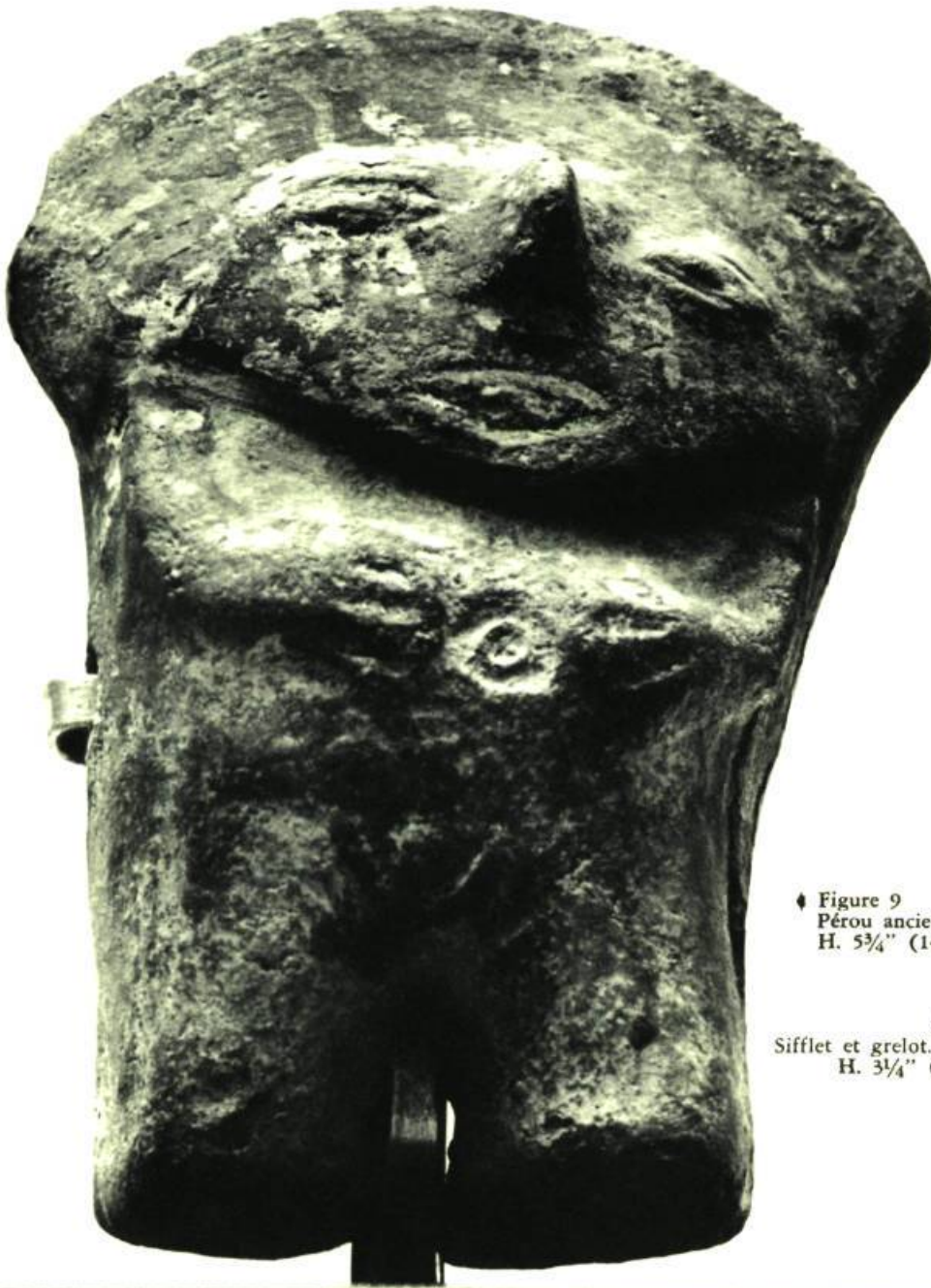
◆ Figure 9 Pérou ancien. H. 5 \frac{3}{4} " (14,65 cm.)

Fécondité et femme-fruit encore que cette autre pièce très archaïque du Pérou (fig. 9) et dont l'obésité symbolique porte le même sens que sa voisine du Mexique. Le nombril est creusé après coup et mis en évidence par une ébauche de geste. Le nombril, signe de filiation, d'appartenance cosmique, lien avec les ancêtres. Les primitifs professent que l'intelligence, comme l'amour de l'homme, son âme quoi, sont logés dans les entrailles. « Le ventre est le lieu de l'intelligence, de la mémoire, des sentiments et du coeur », nous dit le Popol-Vuh qui souligne l'équivalence symbolique entre le coeur et le nombril du ciel et de la terre, terme employé chez les Chortis pour désigner le ciel et la terre, le dieu du centre du monde. L'omphalos ou nombril du monde est toujours le centre mystique du pays, la ville capitale, chez les Grecs (Delphes) chez les Irlandais (Tara) chez les Gaulois (Bourges). L'empire du milieu de la vieille Chine. De même les noirs introduisent au nombril, les matières fétiches souveraines. Et ainsi, dans la Bible, l'auteur du De Profundis dira : Spiritum tuum innova in visceribus meis. Saint Paul ne parle-t-il pas des entrailles de la miséricorde ?