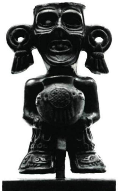
Figure 13. Tlaloc. H. 6 \frac{1}{2} " (16,5 cm.)

Notons ici, une supériorité du primitif : sa capacité d'incarnation dans une vision simultanée du visible et de l'invisible, une saisie plénière de la vie et de ses mystères. Le secret de cette force réside en ceci qu'il ne connaît le réel qu'à mesure qu'il vit. Sa connaissance sourd d'une expérience vécue et non d'une formation tout abstraite et extérieure. (Notre civilisation n'est pas un acquis sans perte.)