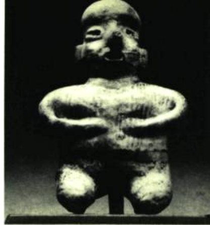
Figure 5 Statue funéraire Colima. H. 6 1/2" (16,5 cm.)