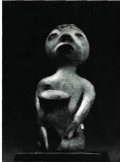
Figure 12. Statuette funéraire Pueblo(?). H. 5 \frac{1}{2} " (14 cm.)