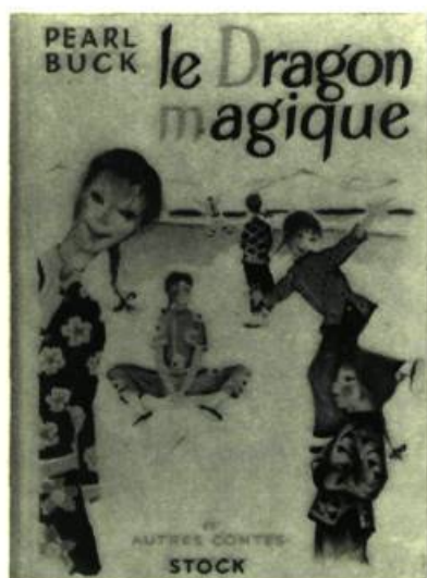
LE DRAGON MAGIQUE par Pearl Buck