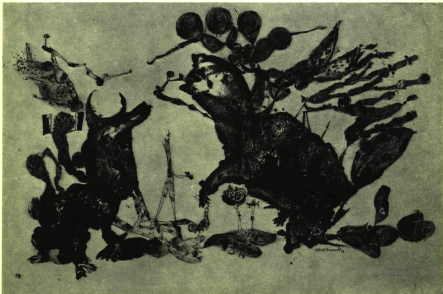
LES CHEVAUX EMBRASÉS. Dessin à la plume. 1951

Une telle éthique au service de dons irrécupérables de coloriste et de dessinateur conduit toujours un homme vers les sommets.