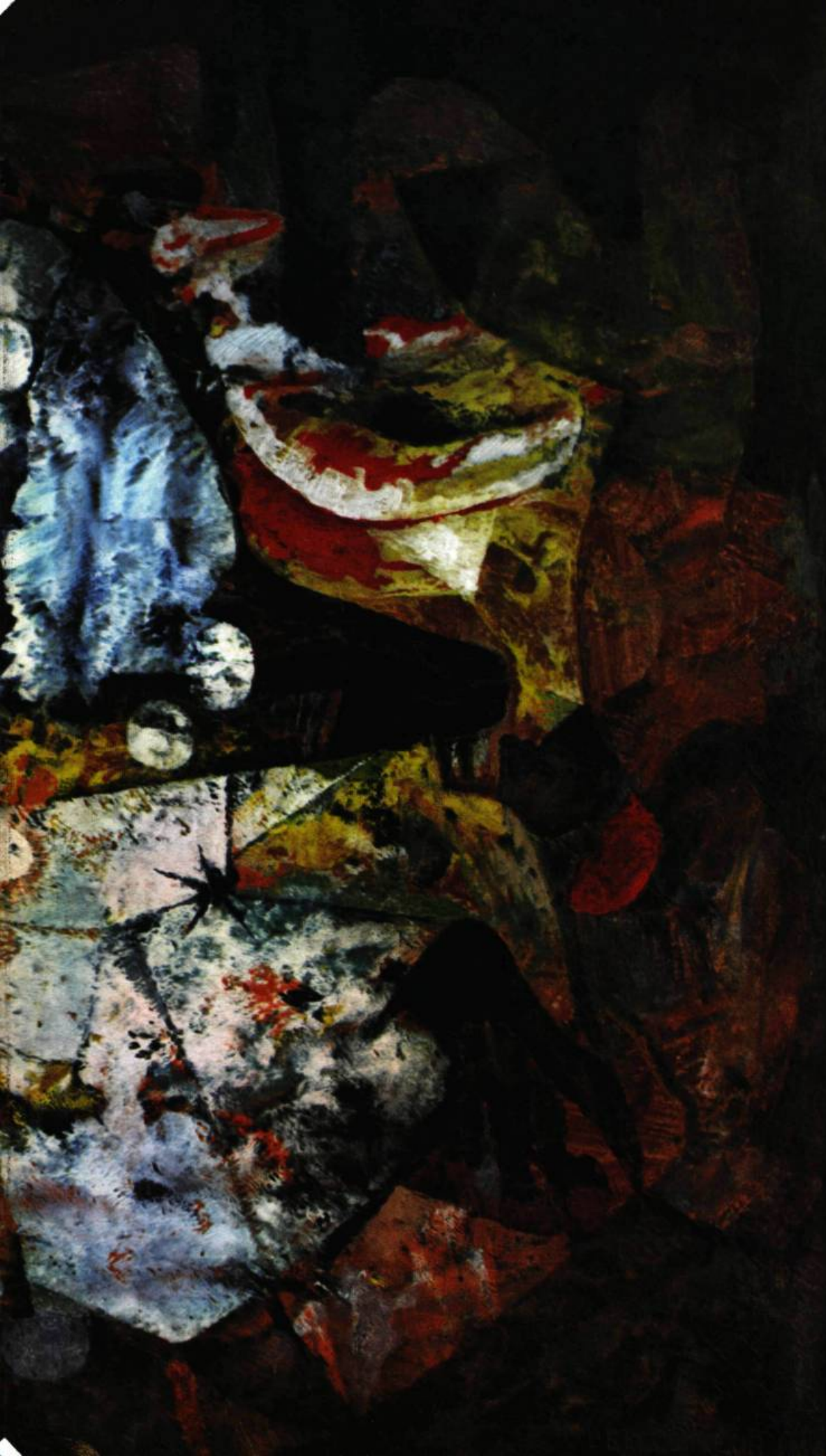
AIGLEFEU. Huile. 1956. 29" x 36". Appartient à l'artiste.