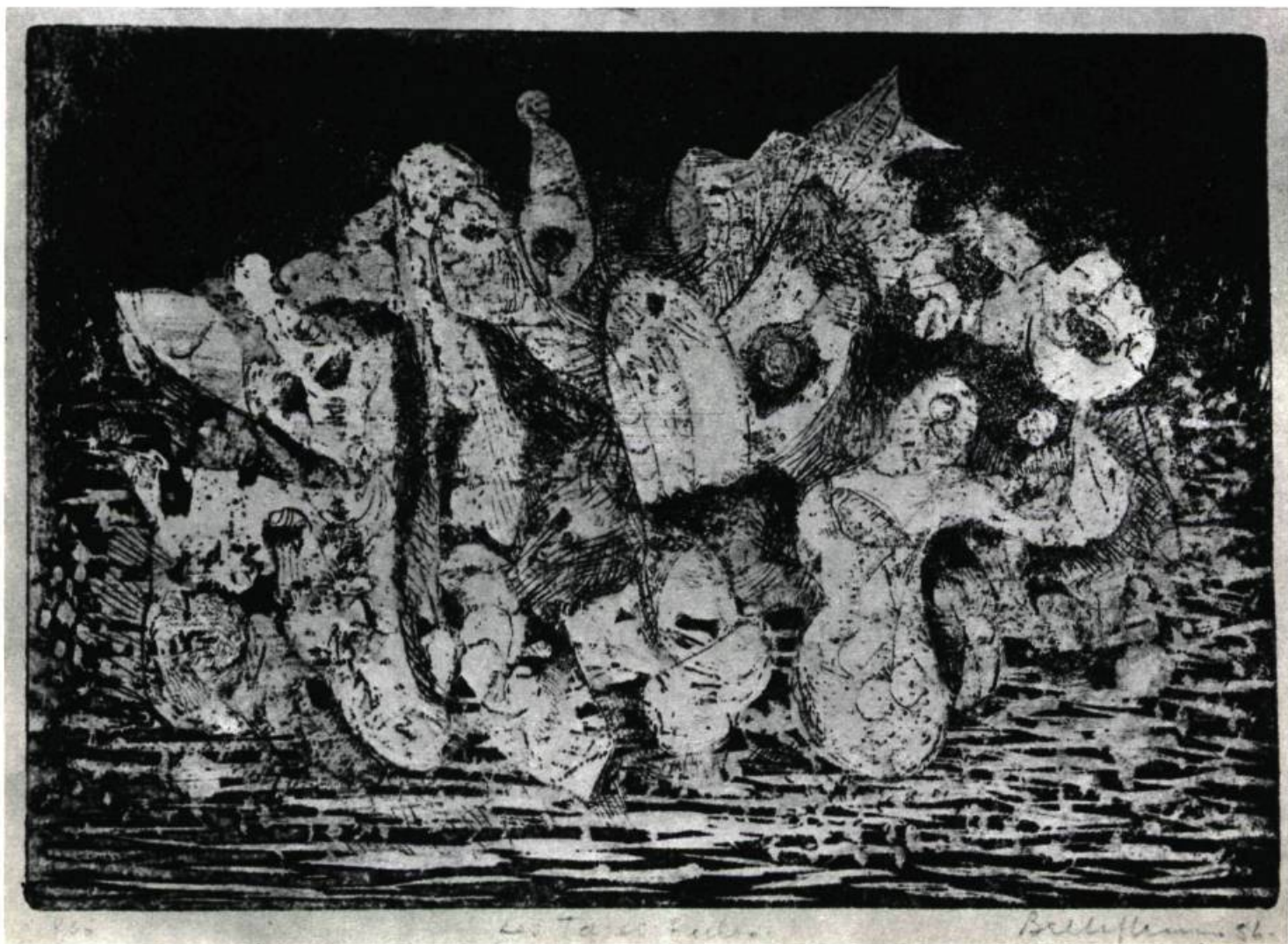
LES TARENTULES. Eau-forte et aquatinte. 1956. 6 1/2" x 9 1/2".

Un monde meurt. Mourant, il naît. Il se dédouble, il vit dans son absence, il se prolonge dans l'explosion instantanée qui le comble au-delà de ses extrêmes possibilités. Il s'engendre et il se tue, il revit au même instant. Il plonge de la clarté dans un faisceau changeant qui joue sur sa noirceur. Il est une ligne. Mais cette ligne n'a jamais cessé de s'ouvrir les veines et les surfaces n'existent plus. Il s'accorde au registre des identités: la terre est le feu, la pierre est l'eau, l'air est le plus solide des corps. Les lignes et les surfaces s'évanouissent; mais les recrée l'épaisseur qui seule compte pour le sens. La couleur fait de même. La couleur est cette épaisseur. La couleur est le pouvoir oblique des espaces comblés de se mouvoir sans cesse dans l'intensité. Plus que de se mouvoir: de se changer, sans aucune mutation de temps, en autant de visages que leur permanence recèle, et le nombre ne s'en compte pas.