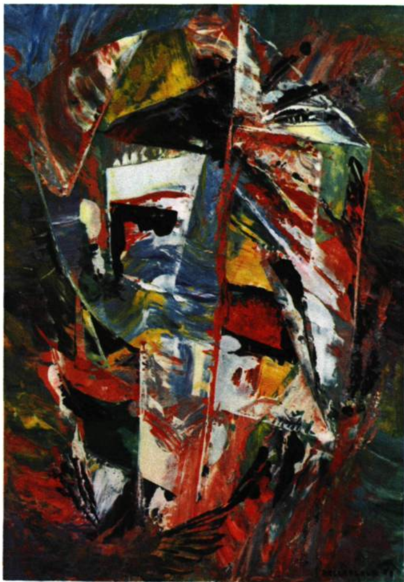
L'OISEAU ÉVENTAIL. Huile. 1957. 21" x 26 \frac{1}{4} ".