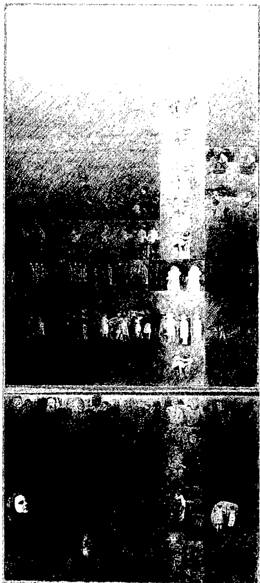
Hélène Roy, Apportez-moi des fleurs... J'en aurai besoin — médium mixte sur papier Arches — 1982. Exposition Célébration du temps , UQAM.