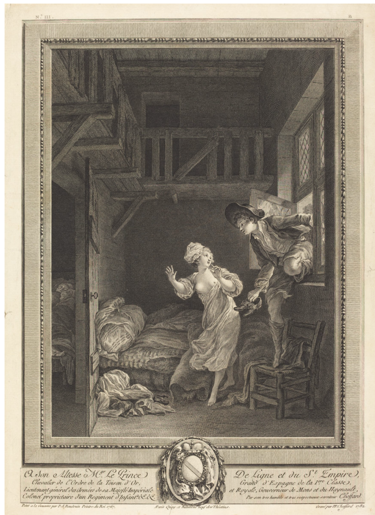
Figure 1 : Pierre-Philippe Choffard, d'après Pierre-Antoine Baudouin, Marchez tout doux, parlez tout bas, ou La Fille mal gardée , 1782, gravure à l'eau forte.

Marine Ganofsky Université de Saint Andrews (Royaume-Uni)